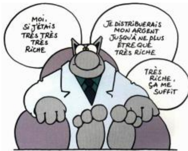
Le Chat ( Philippe Geluck)