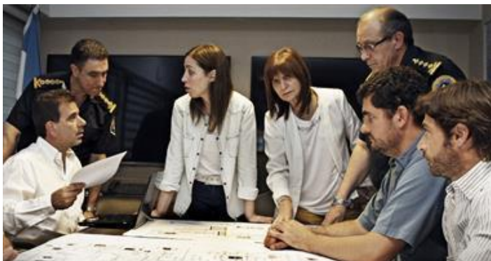
Imagen 1: reunión de Vidal, Ritondo, Bullrich, Burzaco y Salvai en el centro de coordinación policial del Puente 12, en La Matanza.

La imagen 1 al estilo “comando de operaciones”, en la que se encuentran quienes tienen una responsabilidad directa como ministros/as de seguridad junto a la gobernadora de la provincia de Buenos Aires y los efectivos policiales implicados en el caso, también puede analizarse a la luz de los recursos y/o operaciones discursivas regulares que están obligadas a darse de