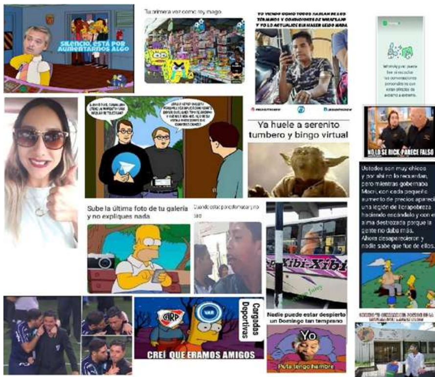
IMAGEN 4. Selección de memes publicados en la página “WhatsApp Jujuy Arg”

Por otra parte, si bien, también considera los tres ejes temáticos la propuesta de WJA es la más acorde a temáticas masivas y “argentinas” como podemos observar en las imágenes que vemos en la 4 propuesta.