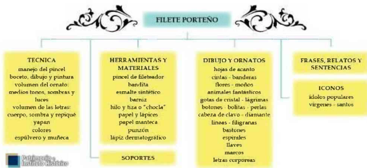
Ilustración 3 – Lo que distingue al Filete Porteño

(En www.fileteypatrimonio.com.ar – en línea: 12 de diciembre de 2015)