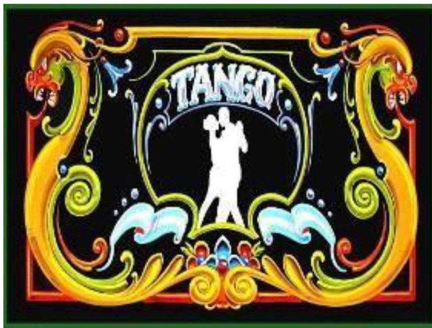
Ilustración 1 - Tango y Fileteado