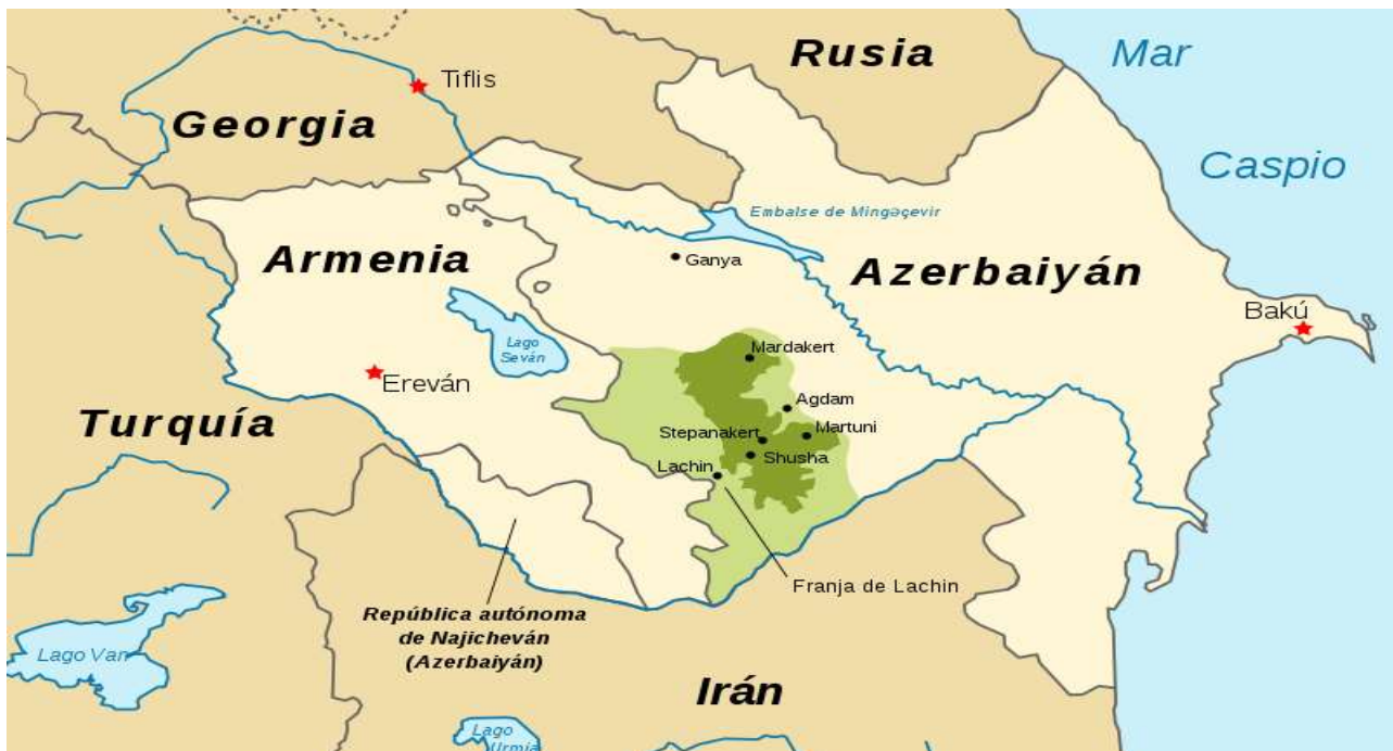
FIGURA N° 1: MAPA DEL TERRITORIO DE NAGORNO KARABAJ TRAS EL FIN DE LAS HOSTILIDADES (1994). EN VERDE CLARO, SE OBSERVA LA FRANJA DE SEGURIDAD IMPUESTA POR LOS ARMENIOS; Y EN VERDE OSCURO, EL ALTO KARABAJ.