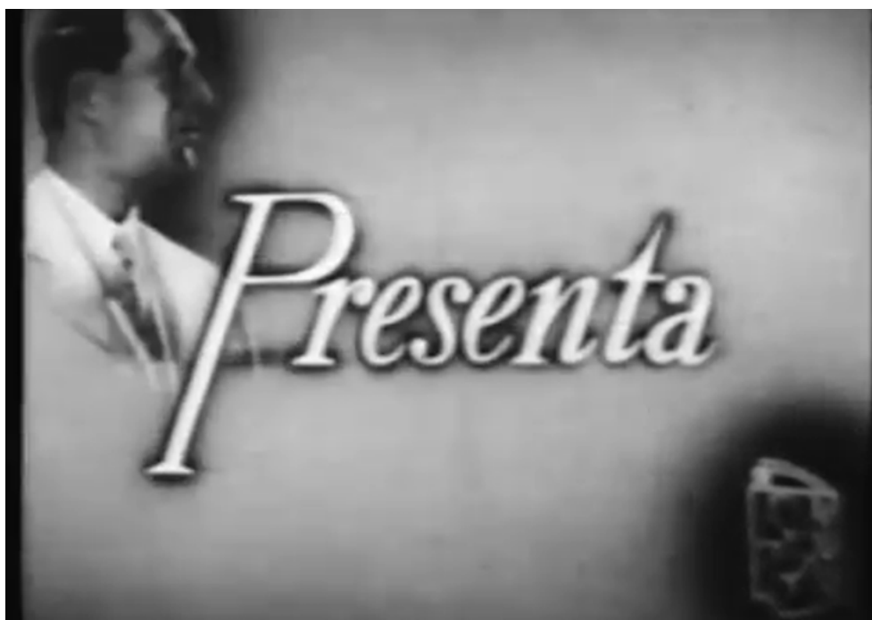
Figura 2. Placa de inicio empleada durante la gobernación de Aloé

Para asegurar la continuidad del proyecto de puesta en valor del NB, las autoridades del AGN convocaron a participar en su redacción a dos integrantes de su plantel profesional con formación especializada y experiencia en la identificación, evaluación y preservación de documentos audiovisuales, Gladys Garay y Ana Pascal, quienes se encargarán de la elaboración y coordinación de un plan de trabajo que integre a las instituciones involucradas [Figura 2].