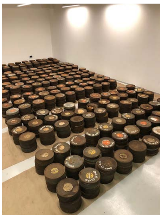
Figura 4. Latas del NB distribuidas en el sexto piso del AGN

tenemos más que una copia de proyección de los noticiarios y los documentales. La existencia de negativos mantiene viva la esperanza de hallar los negativos de cámara y/o los empleados para realizar el tiraje de copias. La presencia de copias de 16 mm comprobaría el empleo de cine-móviles provinciales, transportes especialmente acondicionados para la proyección de películas en las localidades de la provincia que no contaban con salas de cine. También sirve para comenzar a pensar estrategias de organización del trabajo por venir; por ejemplo, el dato de que las placas de inicio del noticiero cambiaron con cada gestión gubernamental nos provee un posible primer criterio de ordenamiento intelectual del material. De igual modo, y ante la eventual ausencia de estas, se pueden emplear otros indicadores provistos por el contexto histórico, tales como la mención al Plan Trienal, correlativo y complementario del Primer Plan Quinquenal del gobierno nacional, o la presencia del logo del Segundo Plan Quinquenal en los intertítulos separadores de noticias durante la gobernación del mayor Carlos Aloé.