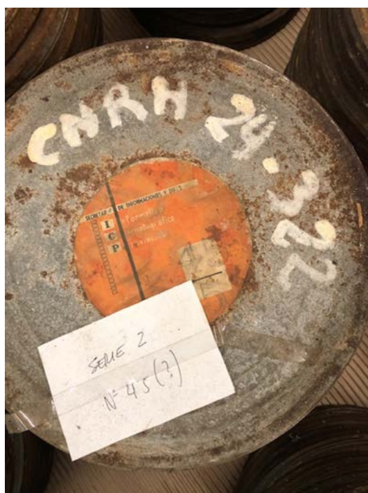
Figura 3. Contenedor con etiqueta legible y número de inventario asignado en el CNRH