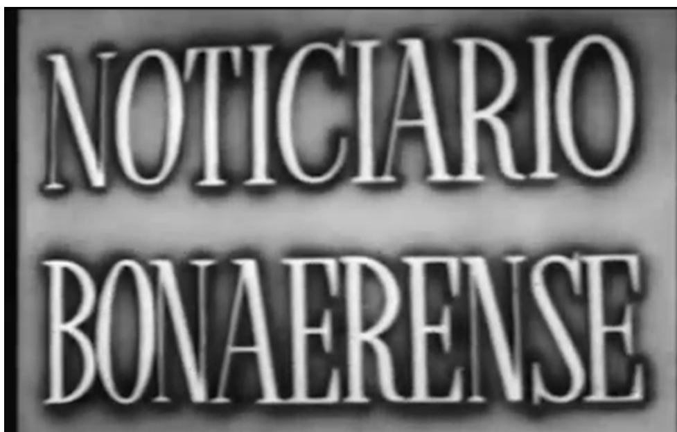
Figura 1. Captura de fotograma del NB

Considerando la importancia que las imágenes audiovisuales tienen en la configuración de la sociedad y de las subjetividades contemporáneas, 2 podemos dimensionar el valor cultural que cobra el proyecto de recuperación y gestión documental del Noticiero bonaerense (1950-1958) (en adelante NB) que llevarán a cabo el Archivo General de la Nación (AGN en adelante) en conjunto con el Archivo Histórico de la Provincia de Buenos Aires Dr. Ricardo Levene, el Colegio Nacional Rafael Hernández (CNRH), la Facultad de Artes (FDA) y el Archivo Histórico de la Universidad Nacional de La Plata (UNLP), bajo la coordinación del primero [Figura 1].