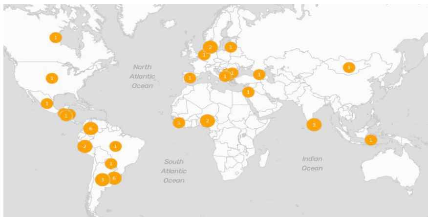
Fig. 1 .Planes Nacionales de Gobierno Abierto.

Por otro lado, otra manera de visualizar el estado de la relación entre Big Data, datos abiertos y salud es considerar los distintos compromisos aprobados por los Estados Nacionales al calor de la Alianza para el Gobierno Abierto (en inglés, OGP) y el peso dado a los pilares que determinan las modalidades que cada Plan de Datos deberá tener.