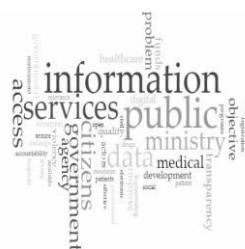
Fig. 3 Tags Compromisos Salud en Inglés

A partir de estas referencias, y en relación a Big Data en el marco de los compromisos de gobierno abierto, podemos inferir, luego de una lectura distante pero también acabada de los textos en cuestión, que los grandes datos aún no son materia de debate en el movimiento de datos o de este tipo de políticas públicas. La discusión en relación con la apertura de los datos ha quedado relegada a los ámbitos privados, de las OSC's y al ámbito académico. Este breve análisis, nos permite inferir al menos que en la región el término “Big Data” no está explícitamente identificado en los discursos de apertura gubernamental; sin embargo, los métodos y técnicas desprendidas de su uso se encuentran de forma subyacente. Por tanto, resta reflexionar en futuras discusiones, narrativas y declaraciones al interior del movimiento de Gobierno Abierto sobre dichas problemáticas a fin de otorgarle visibilidad y un lugar a la temática acerca de Big Data, que deberá considerar su uso e impacto en políticas públicas en el contexto del movimiento.