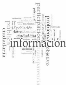
Fig. 2 Tags Compromisos Salud en Castellano

castellano (Fig.2), la afluencia de referencias a transparencia, problemas y ciudadanía infiere una mayor valoración de lo participativo tanto en fuentes de datos como en agendas. En el otro caso (Fig.3), el peso lo tiene el sector público (servicios) emparentado con acceso, data y una clara identificación de actores responsables o con agencia para abrirlos (ministro).