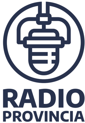
Figura 1. Propuesta de signo marcario