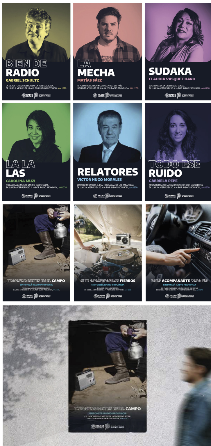
Figura 4. Sistemas de afiches

incidencia [Figura 3]. También, credenciales de prensa para los periodistas, junto con los diferentes elementos que los acompañarán al momento de concurrir a un evento: barbijo para el cuidado del personal, pecheras para la identificación y una funda para celular, para que el entrevistado sepa a qué institución se está dirigiendo ya que, en la actualidad, no se utilizan prioritariamente los micrófonos para los móviles.