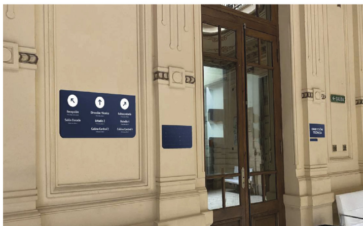
Figura 2. Cartelería interna

El punto de partida fue la construcción de un signo marcario que represente tanto a la radio como a la provincia, sin dejar de lado la idea de unión, consolidación y colectividad, así como los propios valores de la emisora. Busqué la simplicidad con una identidad actual y pregnante [Figura 1]. La fuente tipográfica principal utilizada fue Encode Sans, bajada del manual de marca de la provincia de Buenos Aires. Como fuente secundaria se usó la fuente Alata, la cual fue empleada tanto para el eslogan como para piezas gráficas.