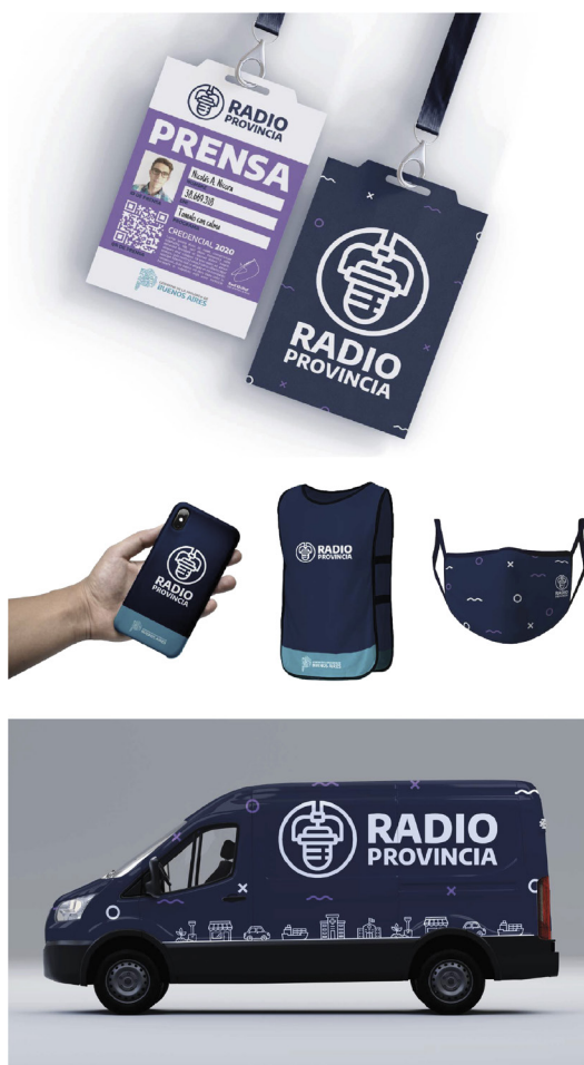
Figura 3. Gráfica vehicular y elementos para movileros

Hice dos sistemas de afiches para la vía pública. Uno tiene la intención de destacar los referentes que participan en la programación a través de una fotografía y de un texto con el título del programa. El segundo busca generar empatía con el oyente mediante interpelación con fotografías que muestran situaciones cotidianas donde la radio está presente y la frase que acompaña la foto hace alusión a los distintos programas que se emiten [Figura 4].