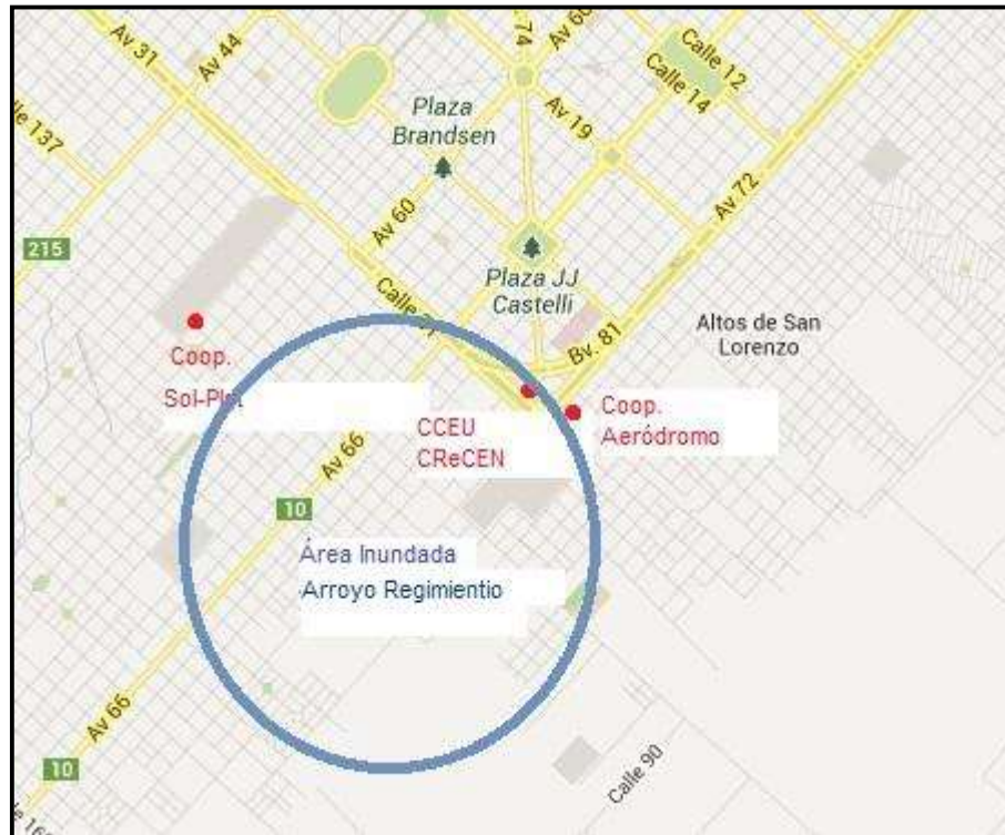
Imagen N° 2

Hornos, hasta la Cooperativa de Trabajo Sol Plat Limitada, ubicada en la intersección de las calles 57 y 139.