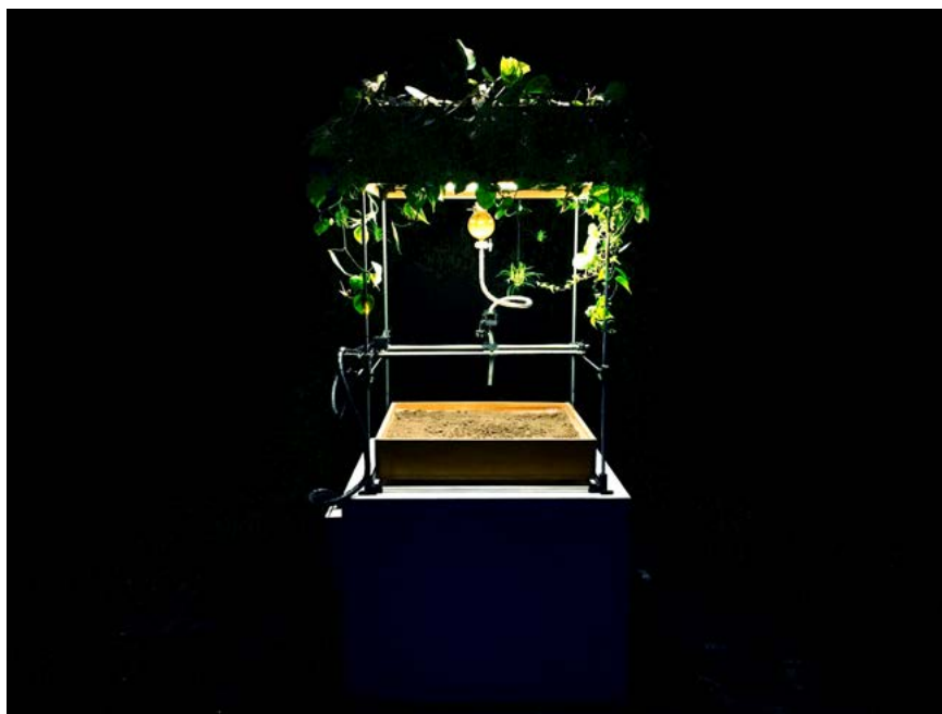
Figura 2. Eisenia, máquina de impresión orgánica (2014), Colectivo Electrobiota. Noviembre Electrónico, Centro Cultural San Martín, 2018.

tecnocientífico hegemónico mediante una máquina inútil 3 que tarda entre doce y dieciséis horas en culminar un ciclo de regado.