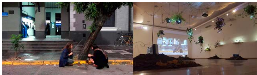
Figura 1. Rizosfera FM (2016), Colectivo Electrobiota. 1.º premio en el Segundo Concurso de Artes Electrónicas de la UNTREF, MUNTREF.