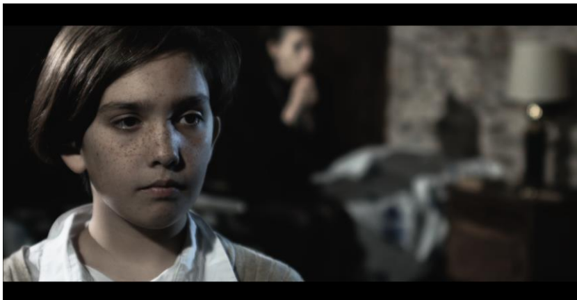
Figura 3. Foco en el pequeño.