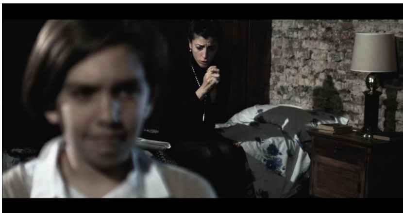
Figura 4. Foco en la madre.