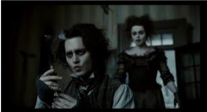
Figura 2. Foco diferenciado en la escena del film Sweeney Todd: The Demon Barber of Fleet Street (2007). Tim Burton.

se buscó mostrar la poca relación entre los dos personajes apreciándose la distancia entre ambos, física y emocionalmente, desviando la atención del espectador de un punto a otro. Como por ejemplo se puede observar en la figura 2 . de un film referente, tanto como en su implementación en las figuras 3 y 4 .