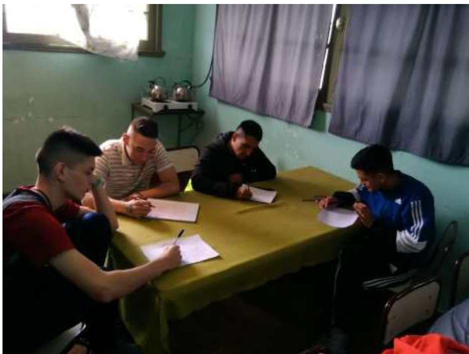
Produciendo los guiones.