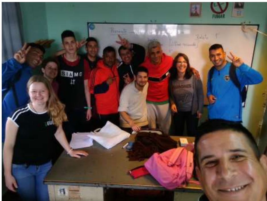
Emociones en el cierre del Taller.