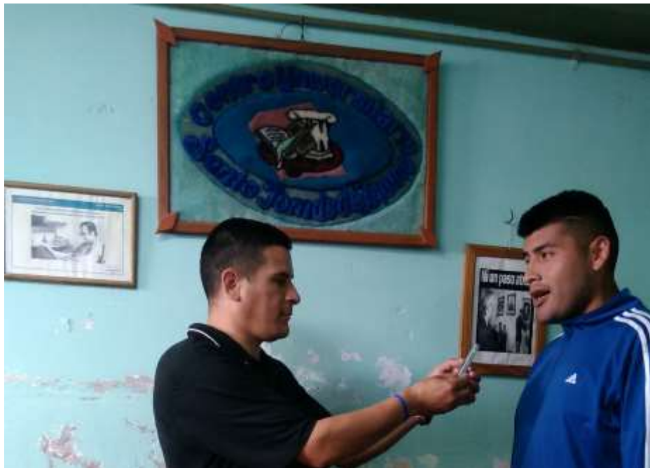
Momento de registro de audio.