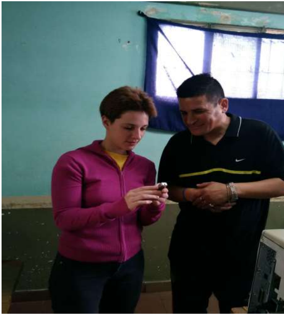
Aprendiendo a usar el grabador.