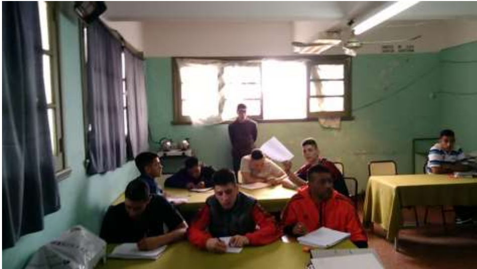
Concentración y producción de relatos.