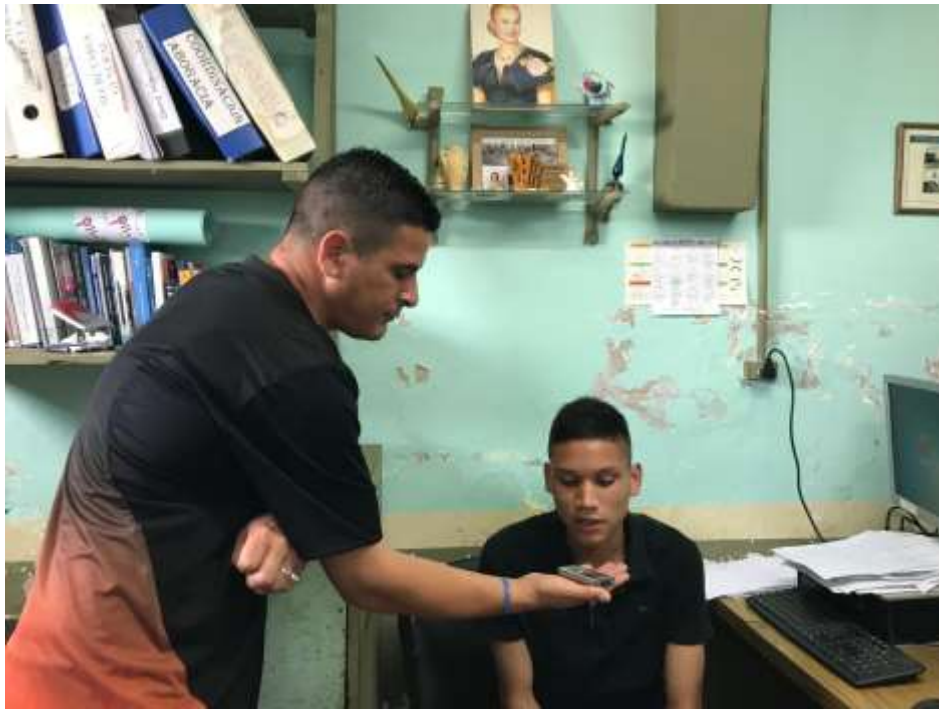
Seguimos grabando cada producción.