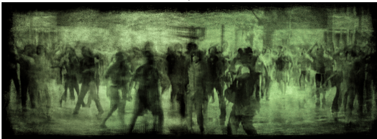
IMAGEN 2 Sin título (Hugo Aveta, 2013).

En la Imagen 2, apaisada, vemos unas figuras humanas que nos remiten a una línea de resistencia. Detrás de ella podemos advertir una multitud formando en un continuo las barricadas. Las figuras del centro resaltan sobre un plano profundo, pudiendo distinguirse algunos brazos levantados y piernas en movimiento: cuerpos que se encuentran dispuestos a la lucha.