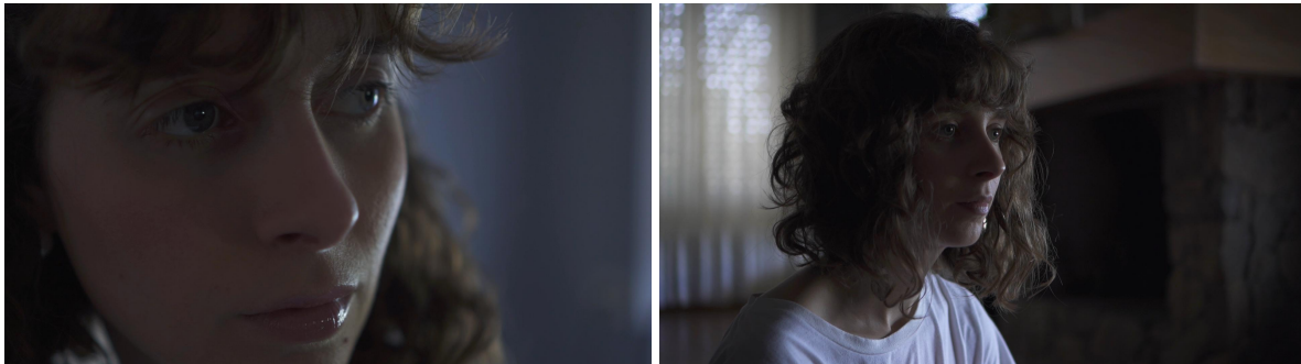
Fotogramas del Proyecto de Graduación "Inmarchitable".

Una de las dificultades de trabajar con la luz natural, se percibe sobre todo en los exteriores, ya que la luz del día varía en gran medida durante el transcurso de las horas, exigiendo constantes reajustes y limitando el tiempo del rodaje.