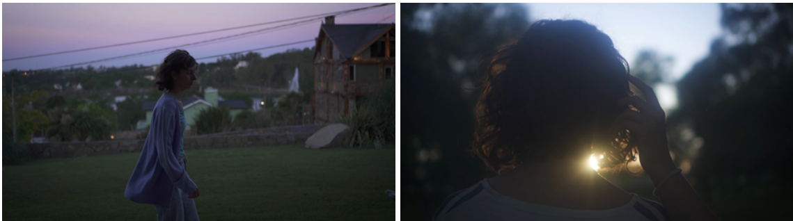
Fotogramas del Proyecto de Graduación "Inmarchitable".

Otro de los motivos, fue el de la practicidad, debido al tiempo acotado con el que contaba el rodaje, y también al hecho de que por sus características, logra brindar una gran posibilidad de adaptación e improvisación ante situaciones adversas. Ya que su implementación facilita la manera de reencuadrar durante la toma y seguir con menor dificultad los movimientos de las actrices, como también permite aprovechar ciertos momentos del día cuya duración es muy breve, como el atardecer o el amanecer.