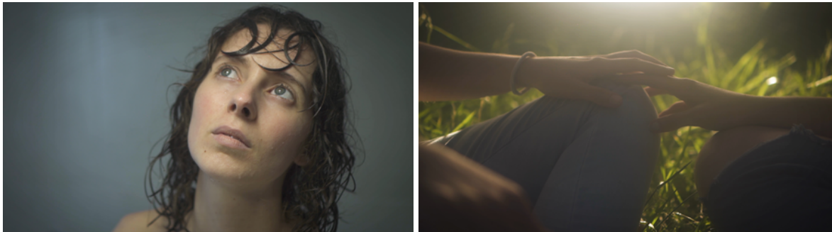
Fotogramas del Proyecto de Graduación "Inmarchitable".

«Cuando un personaje mira un objeto, nosotros, la audiencia, también lo estamos mirando, más o menos a través de sus ojos. La manera en la cual el personaje reacciona (o no reacciona) puede darnos información vital acerca de quién es el personaje y cómo funciona dentro de la situación en la cual se encuentra. Lo mismo es cierto en cuanto al sonido: si no existen momentos en los cuales se le permita a nuestro personaje escuchar el mundo a su alrededor, entonces la audiencia es privada de una importante dimensión de su vida» (p.3).