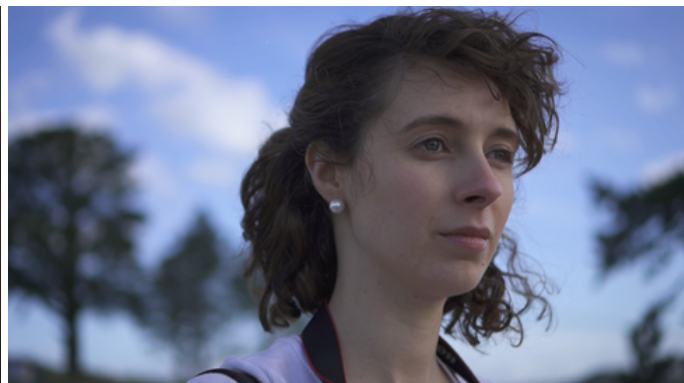
Fotograma del Proyecto de Graduación "Inmarchitable" .

Entendiendo que el movimiento de cámara afecta la forma en la que percibimos el espacio, decidí utilizar en Inmarchitable una cámara poco estática, mediante un gimbal ; una de las razones se debió a que el movimiento de cámara que genera, brinda mayor dinamismo y permite hacer ciertos movimientos y seguimientos creando mayor inquietud y suspenso. Por ejemplo, en el momento previo al primer flashback , el movimiento y la duración del acercamiento de la cámara al rostro de la protagonista, permite generar suspenso y a su vez da tiempo a que la construcción sonora anticipe y nos adentre al flashback .