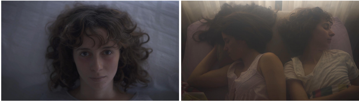
Fotogramas del Proyecto de Graduación "Inmarchitable".

Profundizando en la construcción de los flashbacks , atendiendo a la iluminación, y sobretodo al color y textura de la imagen, se tomó como principal referente a la serie The Haunting of Bly Manor (2020) de Mike Flanagan, ya que en ciertas escenas se brinda un aspecto nostálgico y sombrío que acompaña a la narrativa, mediante la difusión de las luces y líneas de la imagen logrando así una menor definición. Por este motivo, como decisión estética, opté por grabar los recuerdos con un filtro sin rosca, el cual difumina la luz, para otorgar cierta textura, suavizar la imagen y lograr brindar un aspecto efímero al pasado de Alejandra y a la construcción de Sofía.