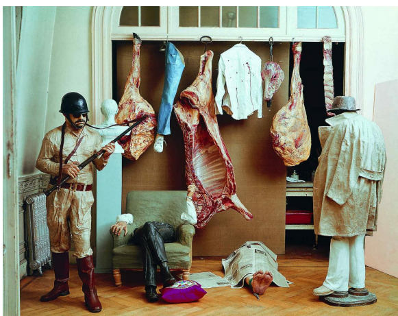
[ Figura 3 ]: Manos Anónimas, Instalación (reconstruida), 1976, Carlos Alonso.

Lo otro que me marcó el rumbo y lo hizo poco tiempo después, cuando logré salir del Liceo, fue ver la impactante obra del gran maestro Carlos Alonso colgada por muchos años en las afueras de la municipalidad de dicha capital cordobesa.