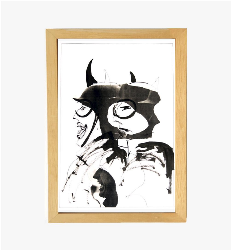
[ Figura 6 y 7 ]: Matías Galante, parte de la serie “ Archivo de la memoria “, trabajo de tesis. Año 2021/2022.