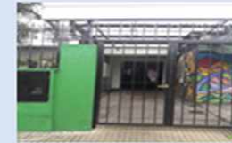
Escuela primaria N°15