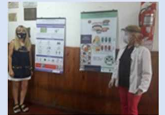
Escuela primaria N° 15

Conclusiones: Según la diversidad geográfica, socioeconómica, hicimos un abordaje en materia epidemiológica que contempla la realidad de esta comunidad de riesgo, en ciernes, informando sobre los síntomas de la enfermedad, normas y recomendaciones para evitar la propagación del virus, causante del coronavirus COVID-19