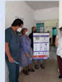
Unidad Sanitaria «Campamento»