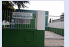
Unidad Sanitaria «Campamento»