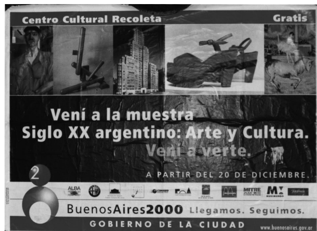
Figura 2. Fotografía (1999). Diseño: s/n. 15 x 10 cm. Fundación IDA, fondo: Puzzovio, Dalila; Squirru, Charlie

Por otro lado, la figura 2 es una fotografía que funciona como registro de un afiche publicitario ubicado en la vía pública, que comunica la exposición colectiva «Siglo xx: Arte y Cultura» que tuvo lugar en el Centro Cultural Recoleta a partir de diciembre del año 1999. En la imagen podemos observar que el afiche se ubicó en los sitios específicos que el Gobierno de la Ciudad Autónoma de Buenos Aires destinó en el espacio público para difundir distintas actividades.