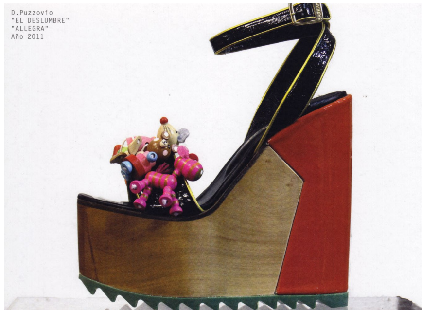
Figura 3a. Postal (2011). [Frente]. Diseño: Dalila Puzzovio. 18 x 12,9 cm. Fundación IDA, fondo: Puzzovio, Dalila; Squirru, Charlie