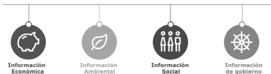
Figura 1 Información clave de los reportes de sostenibilidad

De acuerdo con Lazovska (2019), los reportes de sustentabilidad ayudan a las empresas de cualquier tamaño y constitución a mejorar sus procesos, dar a conocer a las partes involucradas sobre sus prácticas comerciales responsables y de satisfacción de necesidades. Asimismo, desarrollar balances sociales coadyuva a identificar los desafíos globales que se presentan en la economía, sociedad y medio ambiente, tales como abusos a los derechos humanos, cambio climático, pobreza, desigualdad y, ahora, pandemias. En consecuencia, los reportes