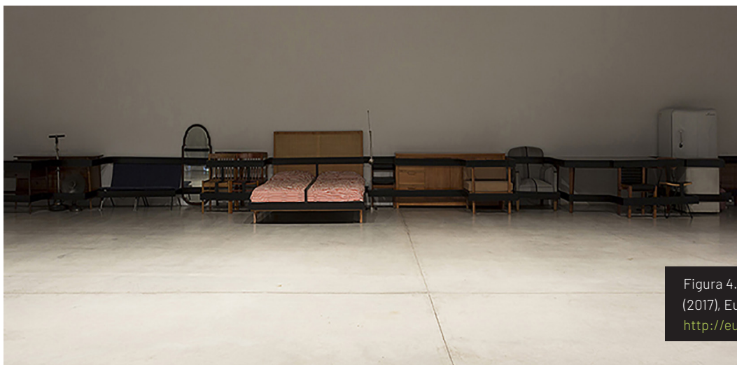
Figura 4. El dominio del mundo (2017), Eugenia Calvo. http://eugeniocalvo.com/

De esta forma, la organización de la sala expositiva es de suma importancia en este proyecto. El sitio elegido presenta grandes dimensiones y un piso de color claro que se asemeja a la palidez de las paredes en una continuidad que busca ampliar el espacio. Además, cuenta con dos puertas que dirigen el recorrido por una especie de pasarela donde los objetos se localizan a una distancia de casi diez metros del público. El foco de atención reside en ese vacío que conecta y a la vez aleja los objetos de los visitantes de la muestra. La puesta en escena funcionaba como una pequeña escenografía en donde parece que va a ocurrir alguna acción: un ring de combate vacío. Aquel espacio intermedio se encuentra iluminado con una luz tenue que exalta la penumbra y marginalidad del grupo de artefactos. Entre los elementos seleccionados por Calvo hay un espejo, el cual permite que el público se refleje en él y forme parte del resto de las cosas. Las bandas de hierro están a la misma altura y tienen idénticas dimensiones a ambos lados de la sala, como si la situación pretendiera presentarse como una réplica en las dos direcciones [Figuras 4 y 5].