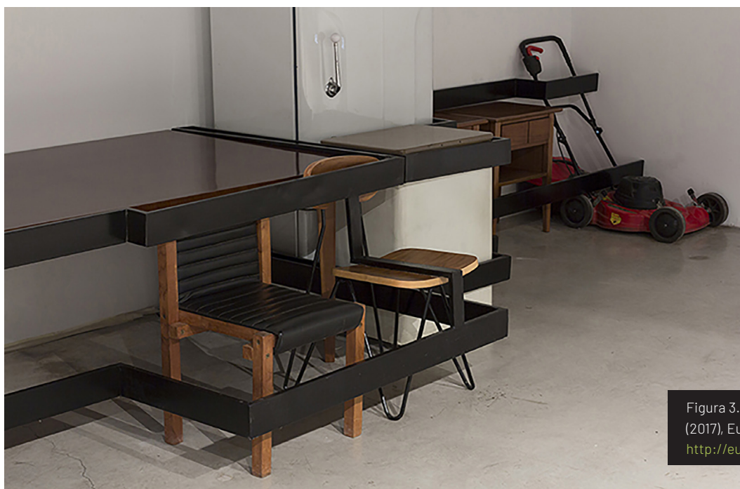
Figura 3. El dominio del mundo (2017), Eugenia Calvo. http://eugeniacalvo.com/

En El dominio del mundo (2017) no aparecen aquellos robustos mobiliarios a los que nos acostumbraba Calvo, sino más bien artefactos de industria nacional diseñados en la década de los sesenta y utilizados en gran medida por la clase media de la época: sillas, sillones, electrodomésticos –heladera y máquina de cortar pasto–, espejo, juegos de dormitorios, etcétera. Por un lado, se utilizan objetos que pertenecían a la fábrica Siam-Di Tella, espacio actualmente destinado a la investigación y enseñanza de grado y de posgrado de artes y ciencias, y sitio elegido para montar dicha instalación. Por otro lado, se ceden en préstamo colecciones de diseño industrial argentino 1 por parte de Fundación IDA, una organización sin fines de lucro dedicada a la investigación, archivo y difusión de la historia cultural, productiva y social de la Argentina 2 [Figura 3].