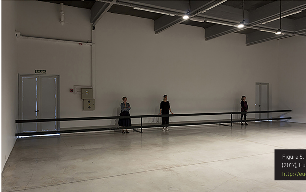
Figura 5. El dominio del mundo (2017), Eugenia Calvo. http://eugeniocalvo.com/

A propósito de esto, la artista comenta: