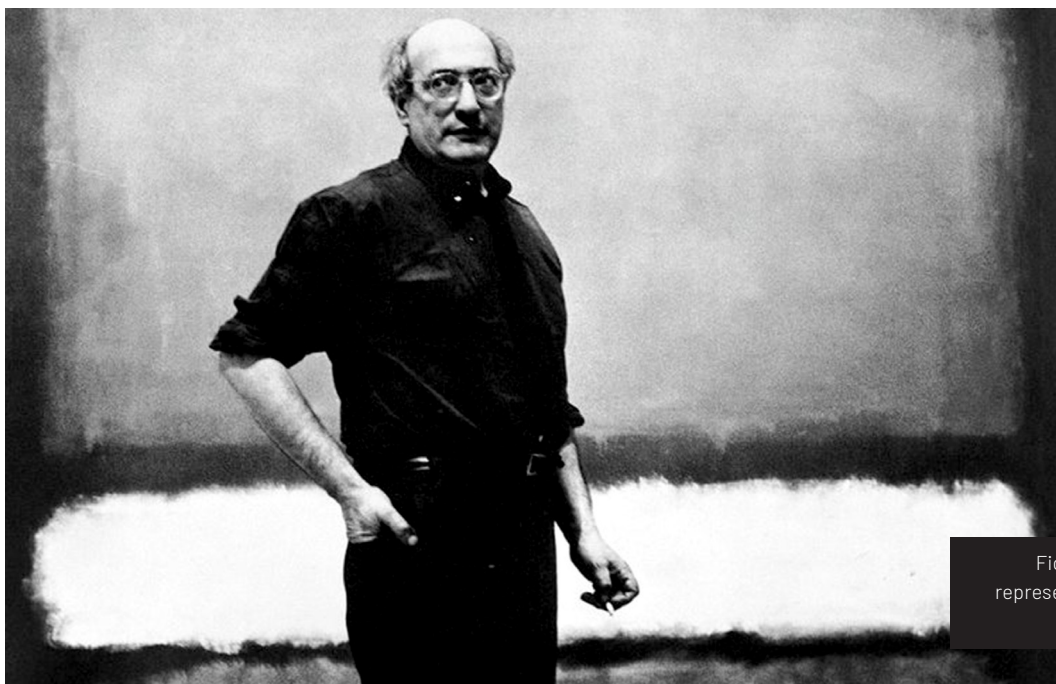
Figura 4. Mark Rothko, figura representativa del expresionismo abstracto

Ese mismo día me puse a investigar sobre el artista nacido en Letonia conocido como Mark Rothko y de forma casi sorpresiva encontré algunos paralelismos con el momento que atravesaba la banda. Descubrí que era un pintor depresivo que durante algunos lapsos de tiempo, cuando una esperanza llegaba a su vida, pintaba con colores más cálidos y líneas o figuras más definidas [Figura 4]. Fue entonces que comencé a pensar en la idea de crear diseños que reflejaran esta dirección.