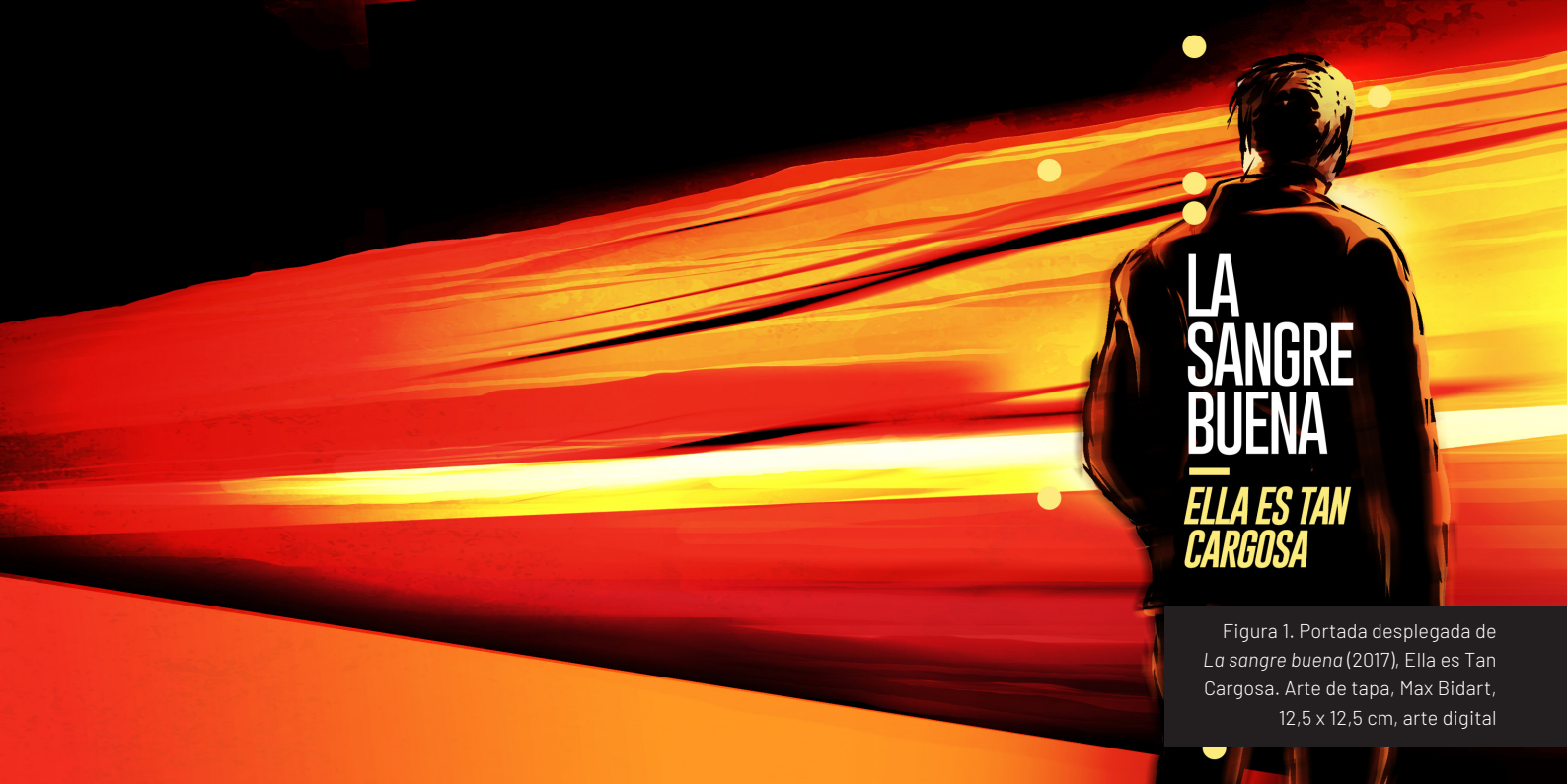
Figura 1. Portada desplegada de La sangre buena (2017), Ella es Tan Cargosa . Arte de tapa, Max Bidart, 12,5 x 12,5 cm, arte digital

Podemos afirmar que el disco compacto es hoy un objeto en vías de extinción, sin embargo, el proceso para diseñar el arte de tapa para un CD físico y su portada electrónica sigue siendo todo un desafío. El auge de las plataformas de audio digitales ha hecho cada vez más complejo el proceso de creación de este tipo de piezas gráficas, el ruido visual y la oferta en los dispositivos de los consumidores se incrementaron considerablemente y la competencia por el click que le dé play a la tapa de nuestro álbum es cada vez mayor. Como actores del oficio gráfico nuestro trabajo en relación con la industria de la música, a primera vista, pareciera consistir en la mera ejecución de un diseño atractivo que cumpla con el objetivo de llamar la atención de todo aquel que esté buscando algo nuevo para escuchar.