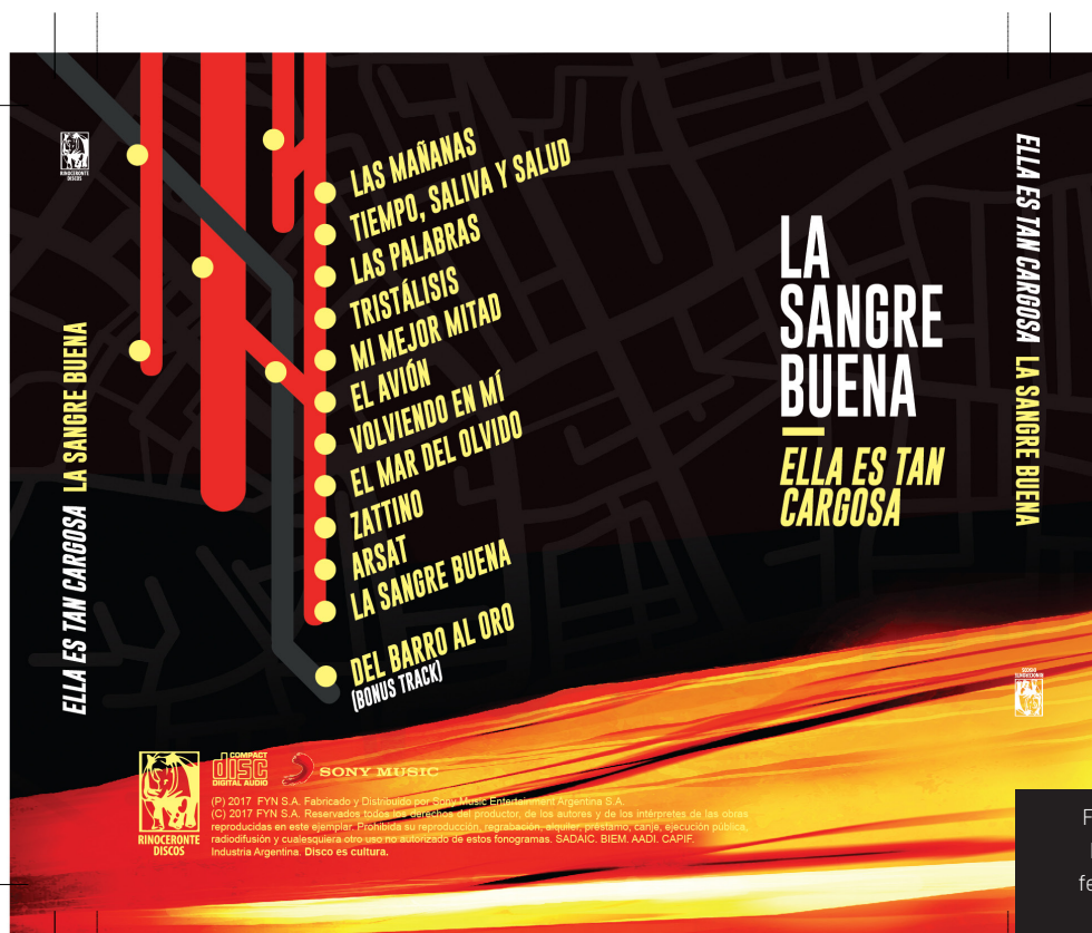
Figura 9. Contratapa del álbum, la sangre a modo de un trazado ferroviario y las canciones como estaciones

El proceso de la contratapa fue más simple, aunque también hace referencia al nombre del álbum con otro juego conceptual, ya que muestra los temas a modo de estaciones en un mapa ferroviario que representa algo así como las venas humanas en donde la sangre buena vuelve a correr otra vez [Figura 9].