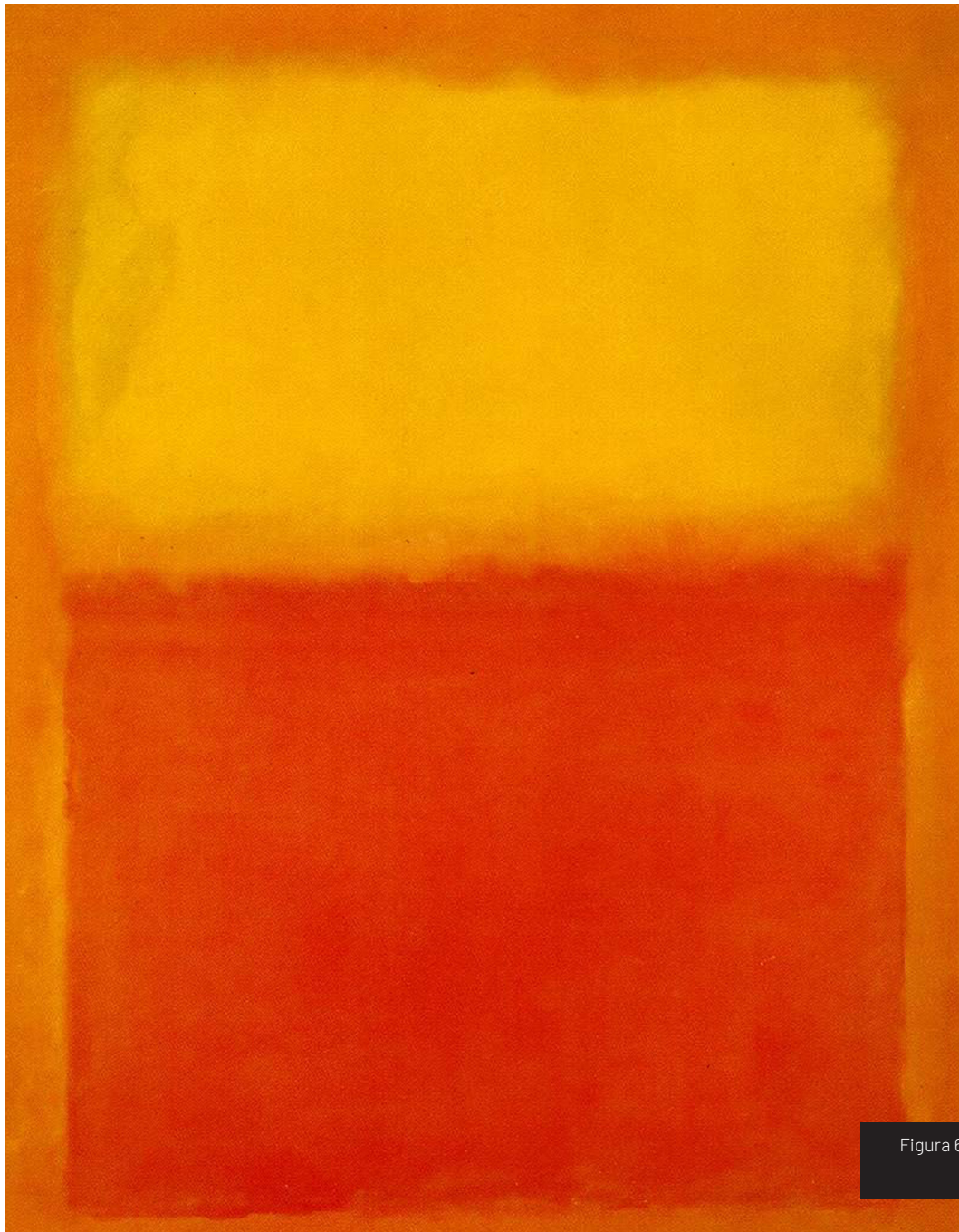
Figura 6. Orange and Yellow (1956), Mark Rothko

Explorando el trabajo de Rothko se me ocurrió mezclar los colores de su obra Orange and Yellow [Figura 6] en donde se presenta un juego de tonalidades similares (justamente naranja y amarillo), sumado al concepto de la nueva chance y junto a un personaje principal esperando un tren para crear un gran collage conceptual.