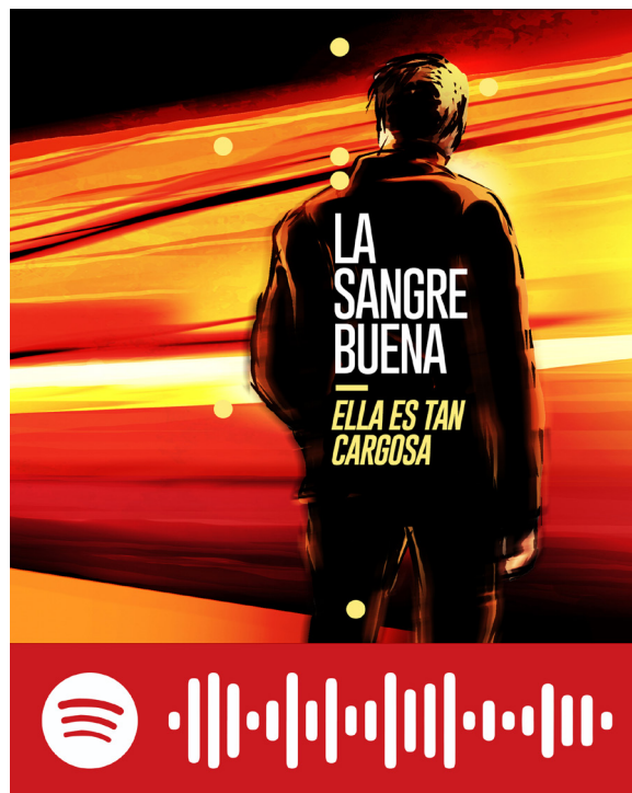
Figura 5. Acceso directo a «La sangre buena». Escaneá el código desde Spotify para acceder a la canción completa

La luz del tren Tiembla y baila a lo lejos Ya estoy de pie, por más que falte un tiempo Será que la sangre empieza a correr Tranquila y limpia otra vez Bien.