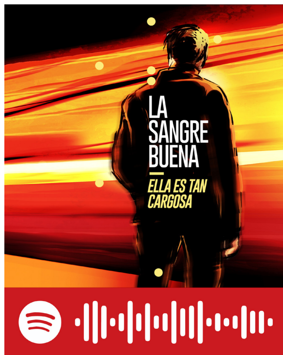
Figura 3. Acceso directo a «Tiempo, saliva y salud». Escaneá el código desde Spotify para acceder a la canción completa

Esta es ya la canción 2000 En la que te pido, casi te ruego Qué pares por Dios Pero es regalar tiempo, saliva y salud.