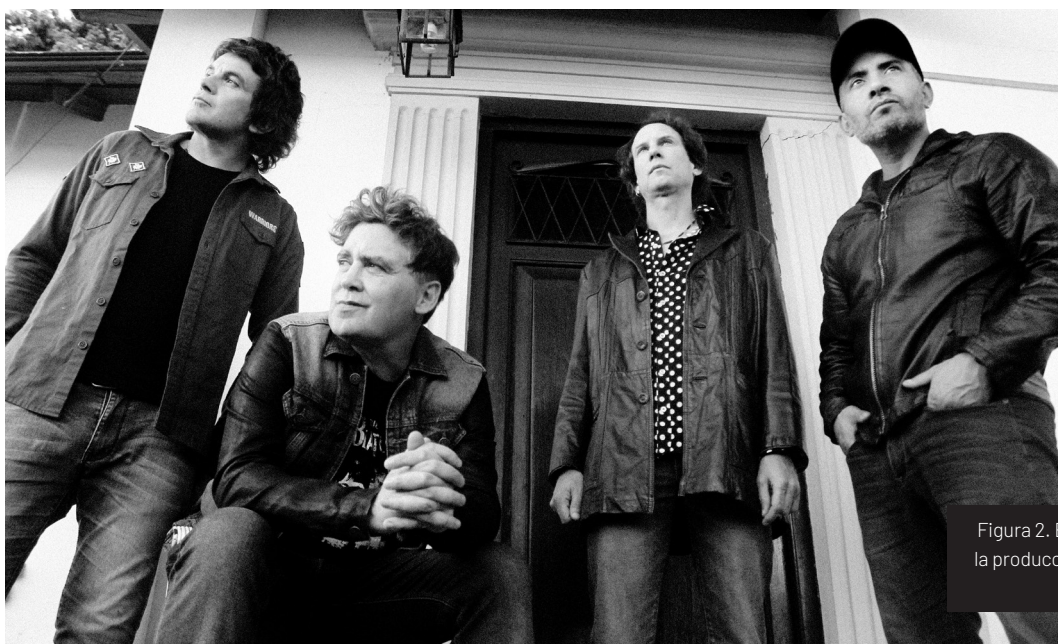
Figura 2. Ella es Tan Cargosa, foto de la producción para el lanzamiento del disco.

Es muy probable que al momento de leer estas líneas aún no tengan bien en claro de quiénes estoy hablando, ahora bien, Ella es Tan Cargosa logró posicionar varias de sus canciones en los primeros puestos de todos los rankings radiales del país y supo ganar los premios Gardel y MTV. Temas como «Ni siquiera entre tus brazos», «Llueve», «Autorretrato» o «Pretensiones» llevaron a la banda a realizar cientos de shows en todo el territorio argentino y, aunque posiblemente no conozcan la cara del cantante ni reconozcan por la calle al guitarrista, los acordes de estas melodías ya forman parte de la banda de sonido de la vida de más de un desprevenido.