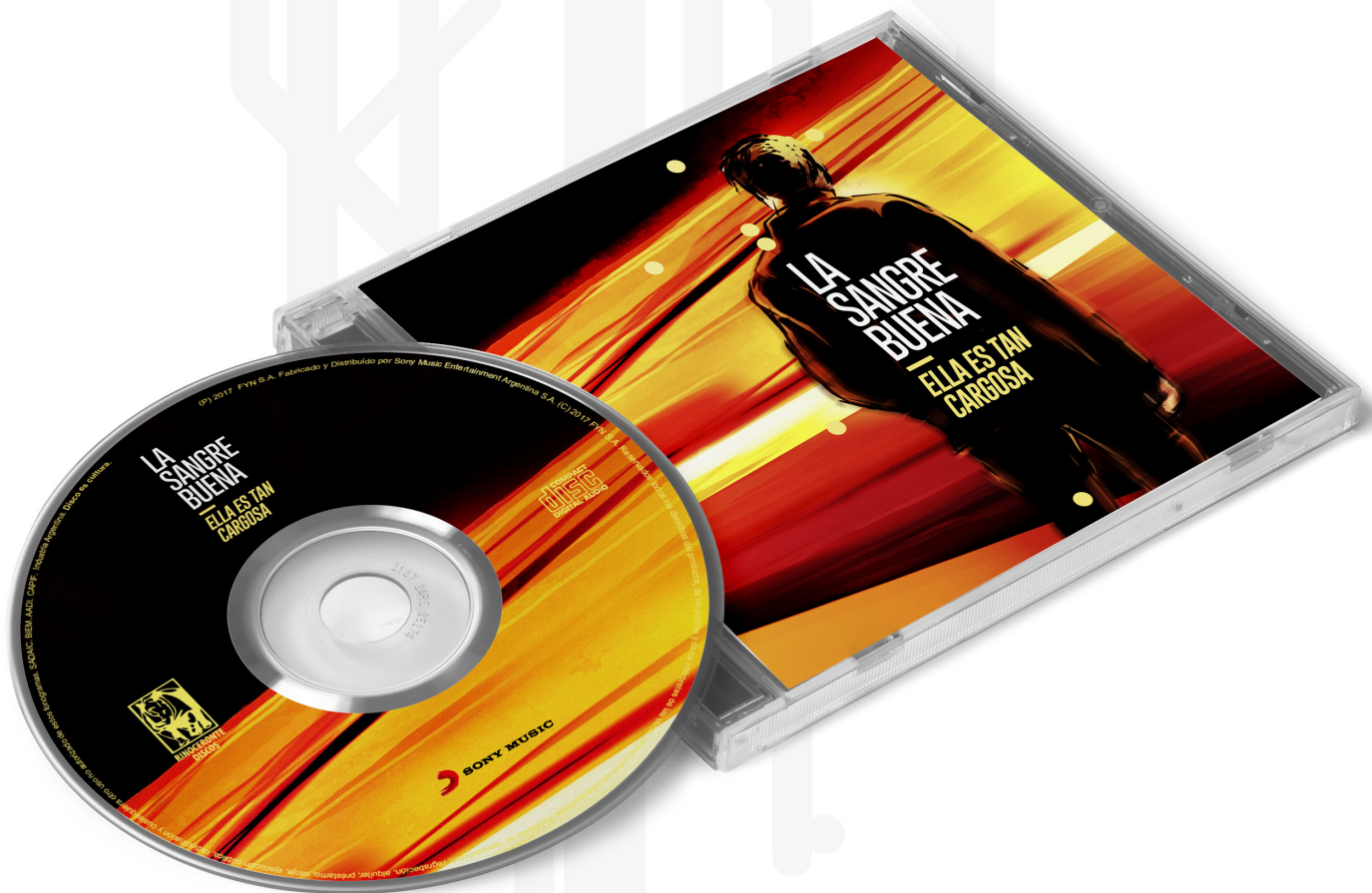
Figura 8. Mockup del CD y arte de tapa de La sangre buena

Asimismo, los colores saturados buscaban enfatizar la pregnancia en una posible batea de discos o el abrirse paso en el contexto de las miles de opciones de tapas digitales en plataformas como Spotify o Youtube [Figura 8].