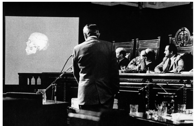
Figura 2. El antropólogo forense norteamericano, Dr. Clyde Snow, declara durante los Juicios a los ex comandantes de las Juntas Militares en abril de 1985.

de conseguir. No somos santos. Tenemos nuestras idas y vueltas, nuestras peleas, pero eso es una política. Y aporta a la credibilidad porque no se intenta sacar ventaja personal, y tampoco se intenta “vendernos” por encima de nuestras posibilidades. Podemos hablar de los límites de cada ciencia, que los tienen. No hay una persona que tenga la llave que abre todo, sino construcciones de saber conjunto en el que se articulan diferentes ramas de la ciencia en pos de un objetivo: develar la verdad y documentarla de manera científica. Eso nos permite ser capaces de ponernos a pensar con el otro cuál es la mejor forma. Eso te baja el perfil y te iguala, además, con el resto de los actores necesarios para resolver un problema. Son muchos los actores necesarios en una búsqueda, y el EAAF es uno más.