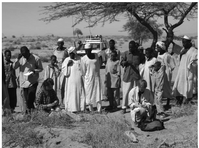
Figura 3. Trabajo de campo en la ciudad de Hager, en Sudán, 2005.

EAAF: ¡Puede reproducirse! De hecho, se está haciendo. Es simplemente la conciliación de distintos saberes para la resolución de un problema. Eso es aplicable a cualquier cosa en el mundo, incluso en una familia. Pero, como dice el dicho, uno más uno son dos, sólo si los dos tienen signo positivo. Hay otros escenarios que no fueron los que inicialmente dieron origen al equipo en los que el saber del equipo se aplica con ese mismo modelo. Es extensible no sólo a donde trabajamos con nuevos escenarios, sino a otros fenómenos en los que no trabajamos y que podría aplicarse.