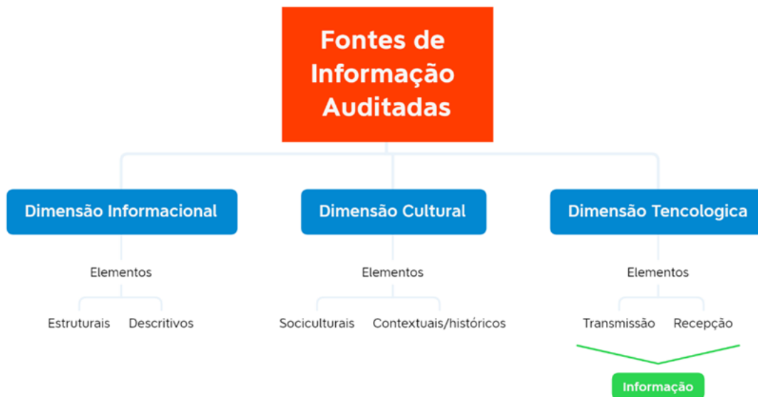
Figura 2. Dimensões metodológicas.

Observando a figura 2 na dimensão informacional, há elementos tradicionais que auxiliam na identificação da qualidade de uma fonte de informação como autoria, data, vinculação institucional, ambiente de transmissão confiável. Esses elementos são somados aos de estrutura, nos quais deve ser levado em consideração: uso de imagens com identificação de origem, títulos com teor apelativo, remissão a outros ambientes e mídias, etc.