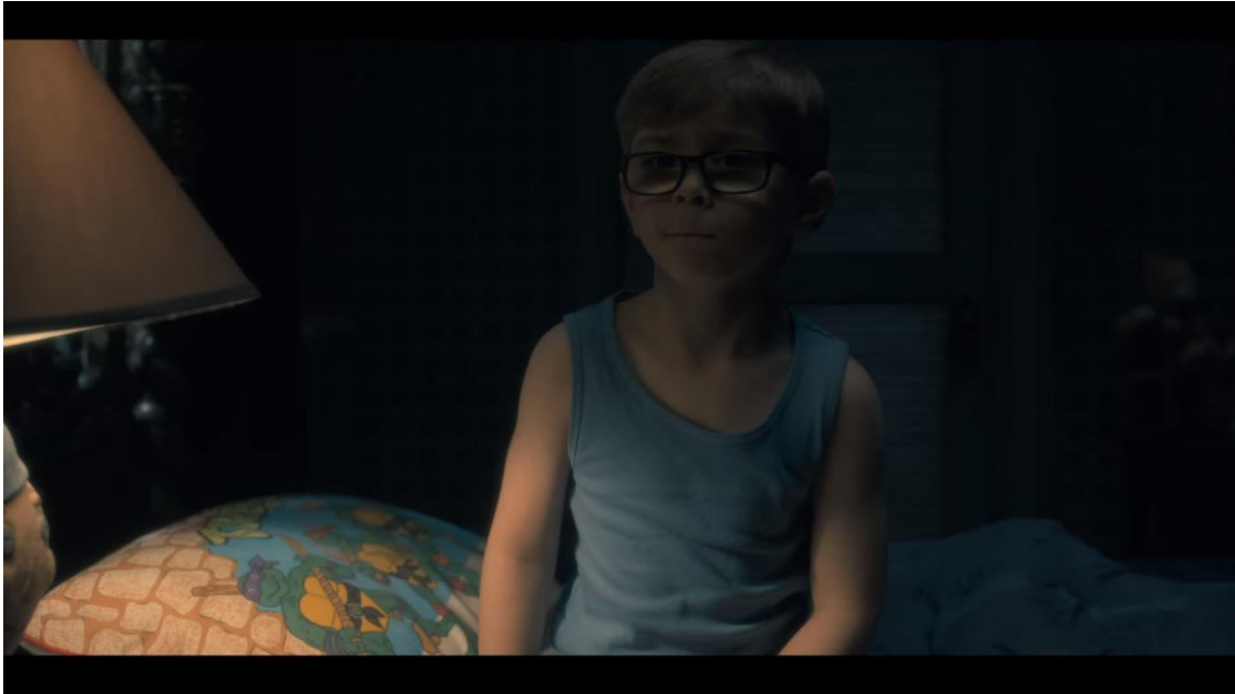
Flanagan Mike, (2017) The Haunting of Hill House. Cap 6 "Two Storms (Dos tormentas)".