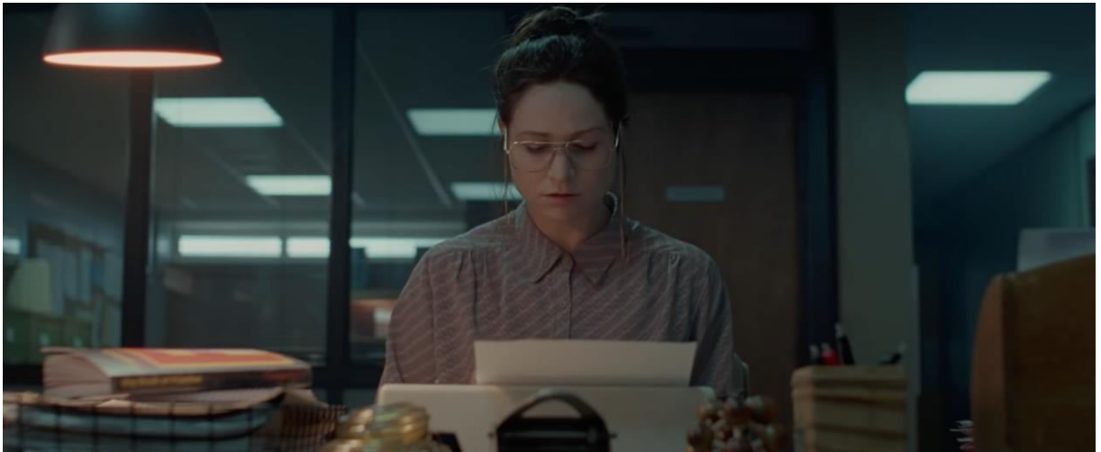
Bailey-Bond Prano, (2021), Censor.