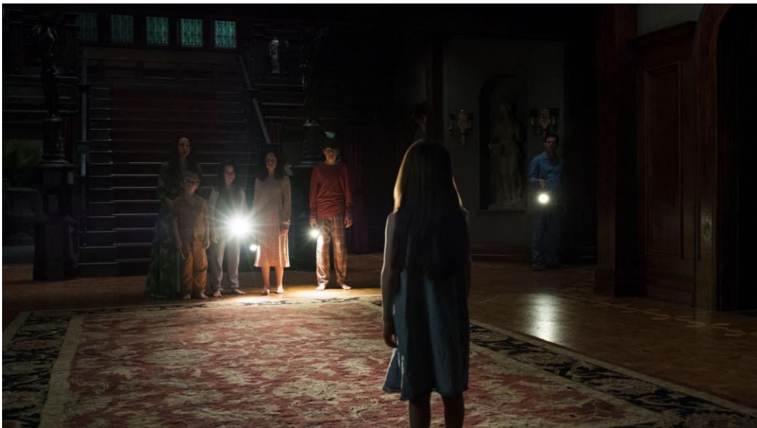
Flanagan Mike, (2017) The Haunting of Hill House. Cap 6 "Two Storms (Dos tormentas)".