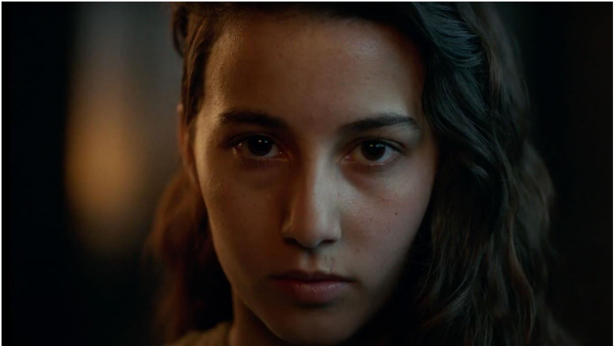
Agüero Pablo, (2020), Akelarre .