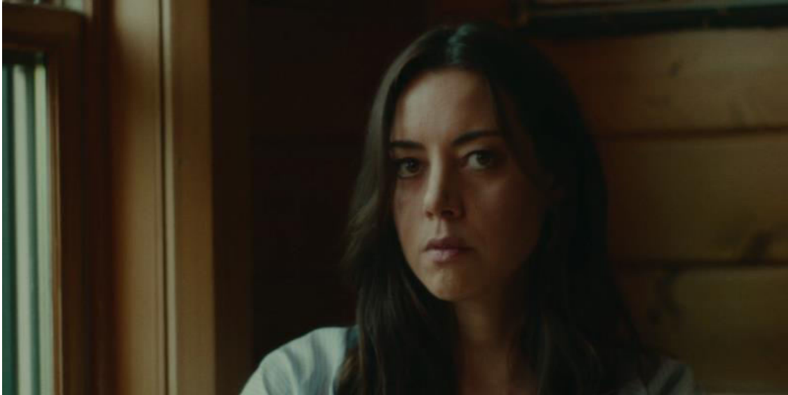
Lawrence Michael Levine, (2020), Black Bear .