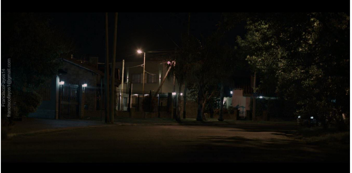
Perillo Sebastián (2021) Las noches son de los monstruos.