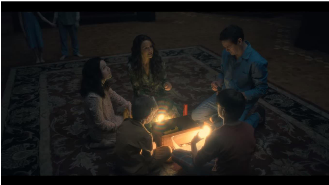
Flanagan Mike, (2017) The Haunting of Hill House. Cap 6 "Two Storms (Dos tormentas)".