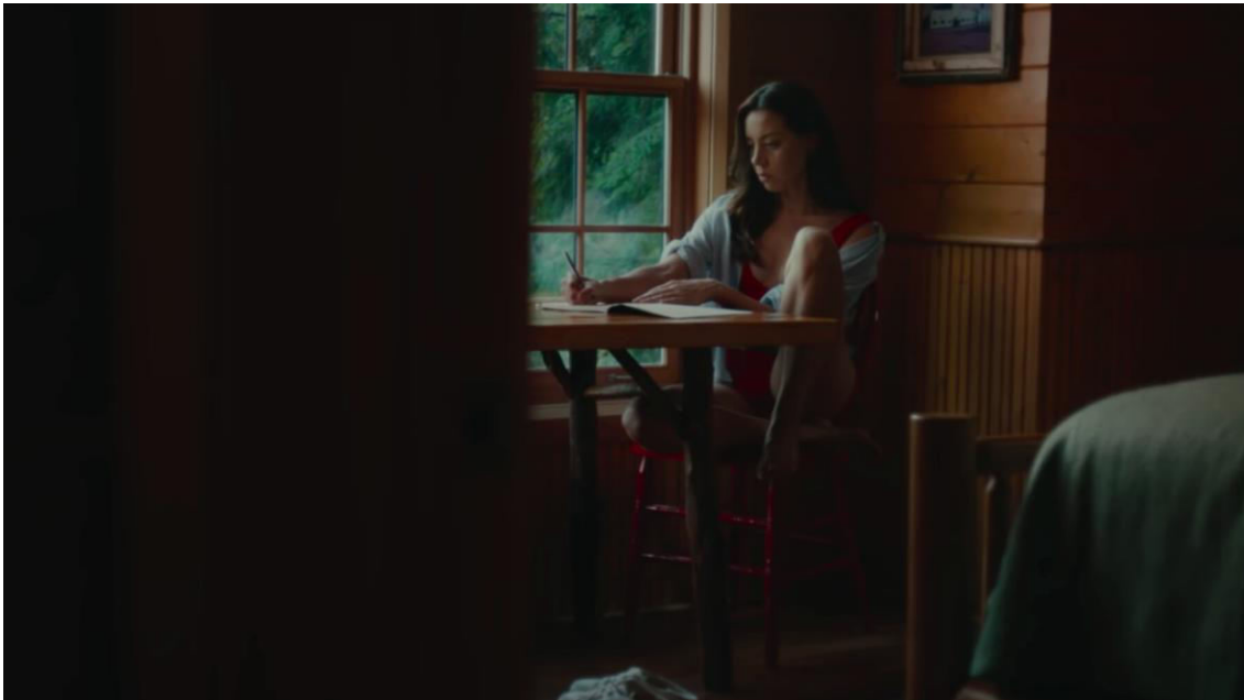
Lawrence Michael Levine, (2020), Black Bear.