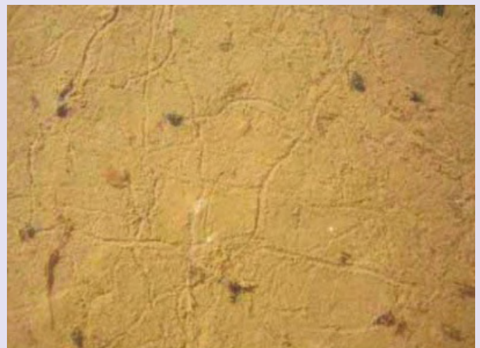
Figura 2. Trazas que deja H. parchappii al desplazarse sobre el sedimento blando.

Martín S.M., V. Núñez, D. E. Gutiérrez Gregoric & A. Rumi (2019). Urban ponds as a potential risk in the transmission of parasites. Rev. Mus. Argentino Cienc. Nat. , 21(1), 59-68