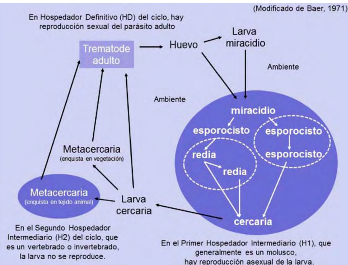
Figura 1. Ciclo generalizado de los parásitos digeneos trematodos (tomado de Darrigran, G.; M. Molina y H. Custodio. 2017a. Fichas Malacológicas: Síntesis y Proyección. Revista Boletín Biológica, 37: 39-40).

En esta Ficha Malacológica se considera al género de bivalvo marino Neolepton sp. (Figura 2). Se analiza la publicación de Presta et al. (2014), que estudia el impacto de digeneos larvarios sobre la especie Neolepton cobbi de Patagonia (Figura 3). Para cumplir con ese objetivo, los autores analizan dos parámetros