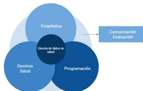
Fig. 1. Modelo conceptual de las habilidades necesarias en ciencia de datos en salud. En base al diagrama de Venn de Conway Drew (2013) “The Data Science Venn Diagram.”

Para la conformación del equipo de trabajo contemplamos las cuatro habilidades que en mayor o menor medida –y de acuerdo a la etapa de análisis- entran en acción en cada proyecto que involucra ciencia de datos, en este caso aplicada al campo de la salud pública. (Fig.1)