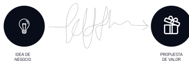
Figura 3 - Esquema del proceso emprendedor en escenarios reales. Elaboración propia.

resulta inconducente pensar estrategias de diseño sin un anclaje espacio-temporal que actúe como marco de referencia de las innovaciones propuestas, y que colabore a la fragmentación de la lógica lineal, determinista y progresiva que planteaba la visión Moderna del diseño [38]. Aquí radica la importancia de generar un discurso emprendedor desde el campo del Diseño y desde nuestra región periférica que abandone esa idea ficticia de “estado del arte global”.