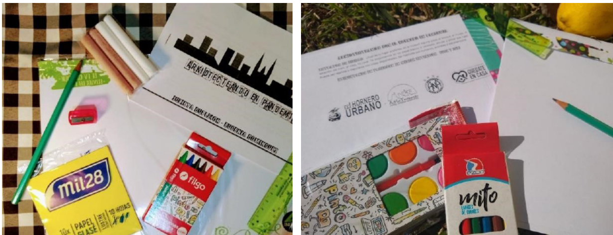
Fuente: elaboración propia. Material del proyecto de extensión.

Los equipos de ArKidTecteando y El hornero urbano estamos agradecidos por la oportunidad de realizar los proyectos en este contexto, donde la universidad con cada convocatoria extensionista ha valorizado esta función primordial, contribuyendo a la solución de problemáticas sociales que afectan a la comunidad.