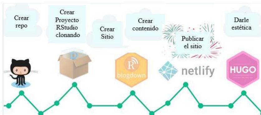
Fig. 3. Proceso de creación y publicación de un proyecto en R-Studio.

Los materiales creados pueden ser alojados, publicados y compartidos mediante estos repositorios de manera eficiente, estando interconectados con el software con el que fueron creados, por ejemplo R-Studio. Un ejemplo del proceso de creación y publicación de material educativo en este tipo de entornos se muestra en la Figura 3.