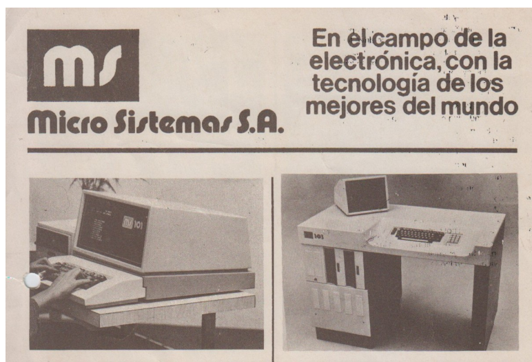
Figura 1. MS 101. Folleto comercial (1979?)

aprovechando el surgimiento del microprocesador, se lanzaron a hacer su propia computadora: se comenzó a trabajar en el prototipo en 1976, al año siguiente estaba listo y se inició su comercialización en 1978. Se trataba de la MS101, que primero prestó servicios en el propio centro de cómputos de Bazán y que, posteriormente, se transformó en un producto en sí mismo, del que se vendieron cerca de trescientos ejemplares en todo el país. La primera micro-computadora de MicroSistemas S.A., la MS 101, fue una máquina dedicada a grabar datos de formato digital en diskettes de 8 pulgadas. Esto evitaba el traslado de la documentación y de esta forma se alcanzaba mayor celeridad y seguridad en el proceso. La MS101 fue un equipo diseñado para la captura de datos, no programable, sino que la misma empresa desarrollaba el software de base para los diferentes usos que requirieran sus clientes. MicroSistemas S.A. tuvo que adaptar sus servicios a la aparición de las “computadoras hogareñas” (home computers) y los sistemas operativos. Desde la empresa tomaron la decisión de fabricar la computadora programable MS104, (con sistema operativo CP / M de Digital Research Inc.). Ésta puede considerarse la primera micro-computadora programable desarrollada íntegramente en Argentina [8].