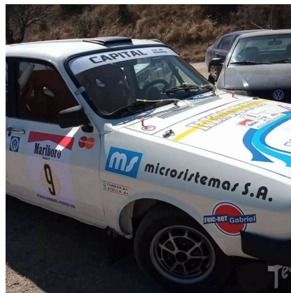
Figura 5. Publicidad de MicroSistemas SA de los '80.

En el análisis de los fondos documentales y testimoniales, además de la extensa bibliografía sobre regulaciones consultada permitieron iluminar algunos pasajes de la historia de MicroSistemas S.A, una empresa cordobesa de tecnología y a través de ella de una parte de la historia de la informática nacional que aún falta profundizar. Se espera que esta contribución logre plantear algunas preguntas que puedan orientar nuevas miradas sobre esta alianza, aportar algunos elementos menos visibles previamente y así pensar otros casos de empresas tecnológicas nacionales inscriptas en lo que se denominó el complejo micro-electrónico de los '80 en la Argentina, que apeló a lograr las autonomía tecnológica en la informática, quizá una de las apuestas más completas de esta breve pero nutrida historia.-