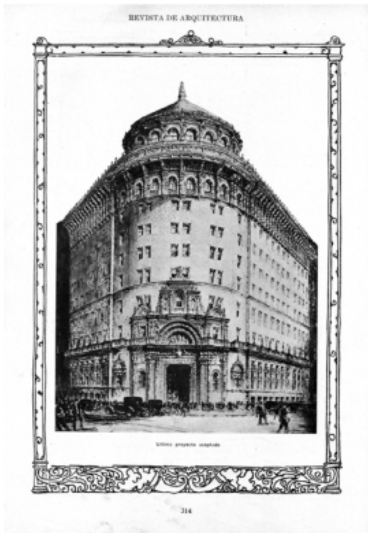
Figura 2. Revista de Arquitectura N° 46, SCA, El Banco de Boston (1924), página entera n°314, formato A4.

La segunda imagen fue realizada por los arquitectos P. B. Chambers y L. Newbery Thomas, como parte de la documentación presentada a la municipalidad para la aprobación del proyecto. Esta representación -junto a otras- fue publicada en la Revista de Arquitectura de la Sociedad Central de Arquitectos en un número extraordinario dedicado al nuevo edificio de The First National Bank of Boston. Al respecto de esto se menciona en la misma: "La Revista de Arquitectura realza hoy el valor de sus páginas con la publicación de este interesante trabajo, convencida de que hace con ello obra de alta educación y cultura."