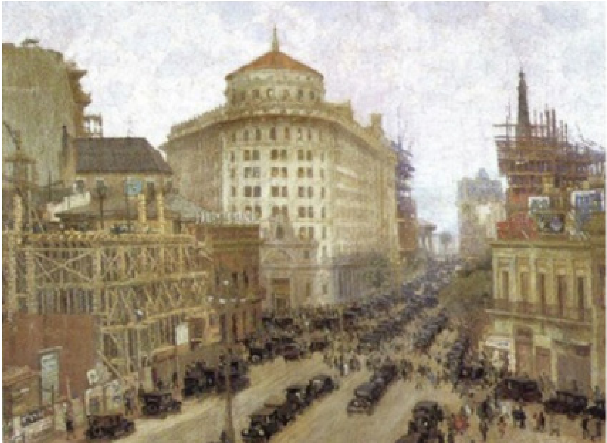
Figura 1. Pío Collivadino, El Banco de Boston (1926), óleo sobre tela, 77 x 100 cm.

La primera imagen es un reflejo de la obra a través de los ojos de un artista. El autor es sensible a la realidad que lo rodea y la forma en la que representa esa realidad va a estar sometida a esa mirada.