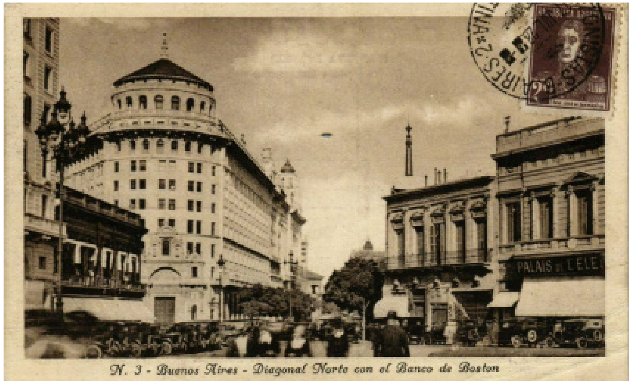
Figura 3. Buenos Aires, Diagonal Norte con el Banco de Boston, carta postal.

en la metrópoli representada de manera difusa: tránsito, peatones que van y vienen expresan el ferviente movimiento asociado a la actividad financiera. Este tipo de imagen tiene como fin pre visualizar la totalidad de la obra antes de su materialización. Es precisa, de carácter informativo y está dirigida tanto al público especializado como al público en general.