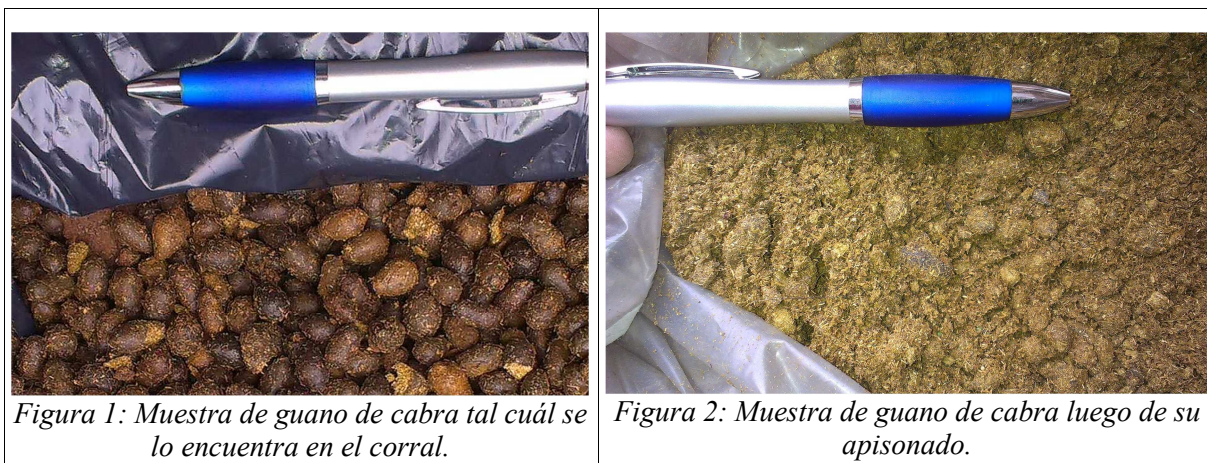
Figura 1: Muestra de guano de cabra tal cuál se lo encuentra en el corral.