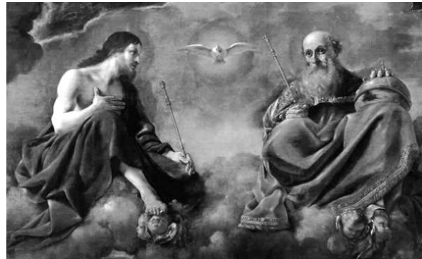
Representación artística de la Santísima Trinidad según Guercino (1591-1666), Giovanni Francescon Barbieri.

Hipóstasis de la Santa Trinidad Cristiana: el Padre (Pater), El Hijo (Filius) y el Espíritu Santo (Espiritus Sanctus). En el centro se encuentra Dios.