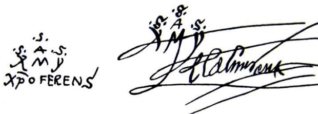
Gráfico 1: Dos variantes de la firma de Colón, a la izquierda como “XpoFerens” (El portador de Cristo), a la derecha como “El Almirante”.

La primera de las cuatro firmas del Almirante que nos interesa analizar es: