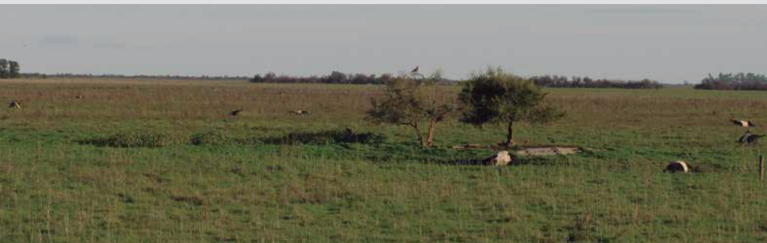
Vista panorámica de la mortandad.