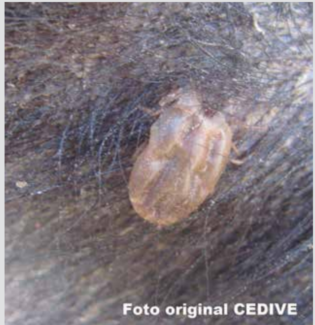
Ninfa de R. microplus parasitando un bovino.