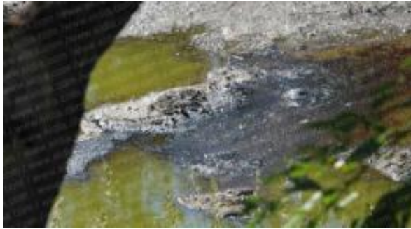
Mancha en el Canal Este de Berisso, producida por la empresa Repsol-YPF