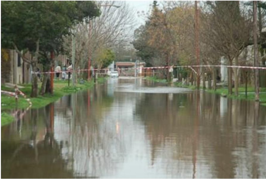
Foto del casco céntrico de la ciudad, luego de una fuerte lluvia.