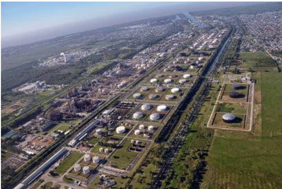
Vista aérea del Polo Petroquímico a la altura de YPF