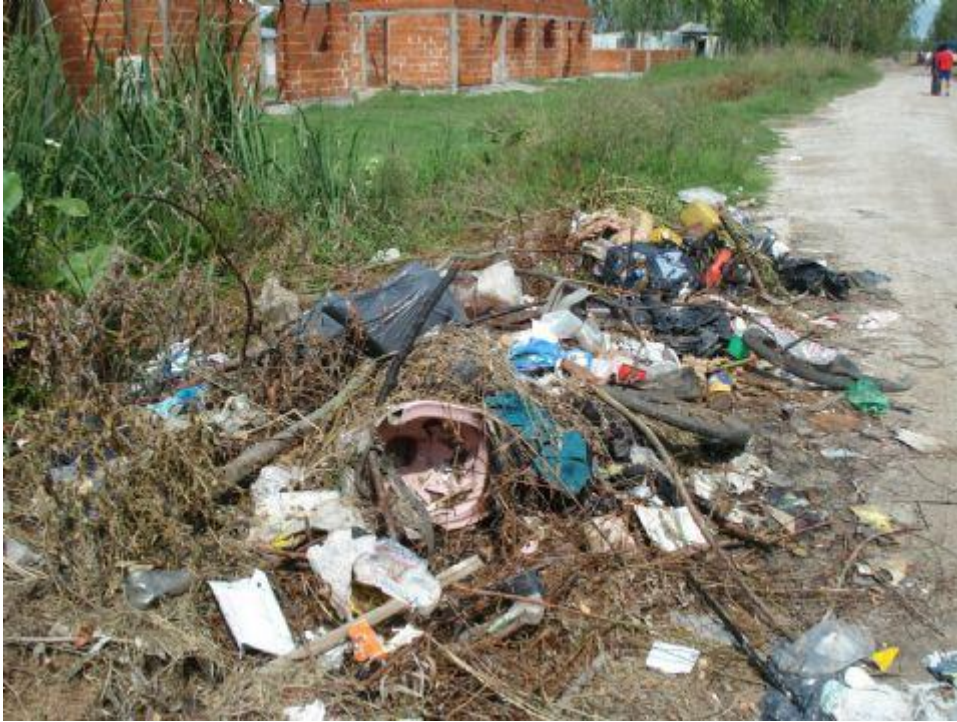
Basural en el barrio Banco Provincia.