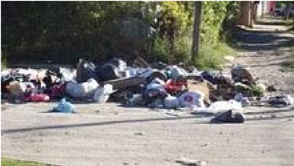
Foto de Villa Arguello