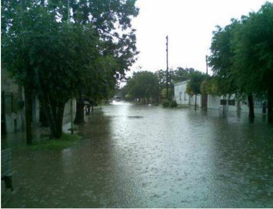
Foto de las calles del barrio Villa Nueva, luego de una fuerte lluvia.