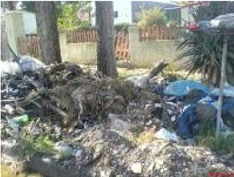
Basural producido en una de las calles del barrio El Carmen