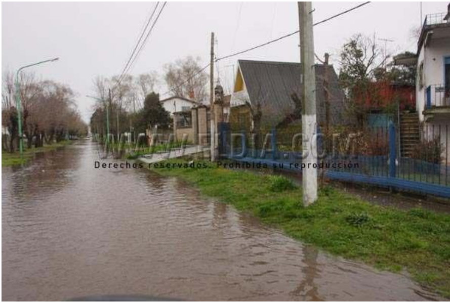
Crecida del Rio de La Plata que afecto a la localidad de Berisso en el año 2010