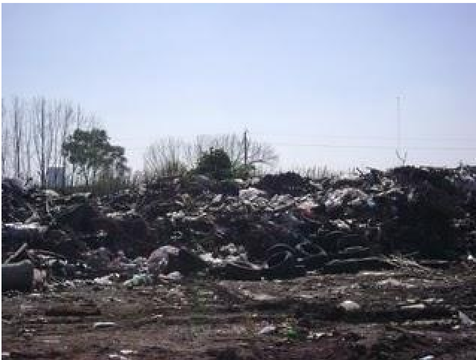
Foto del basural este basural esta alojado en la calle 14 y 130 Berisso