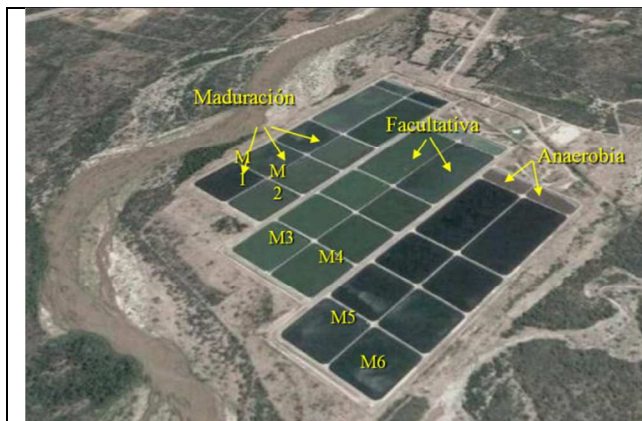
Figura 1. Imagen satelital del sistema de lagunas de estabilización de la Ciudad Capital de Catamarca. Módulos de Tratamiento.

Esta práctica cobra gran importancia en zonas áridas, donde la escasez de recursos hídricos limita el desarrollo agrícola-ganadero. Esto ocurre en gran parte de la provincia de Catamarca donde existe una fuerte demanda de agua para actividades productivas, en particular en el departamento Valle Viejo y en áreas próximas a la planta de tratamiento de líquidos cloacales. Se trata de un sistema de lagunas de estabilización, constituido por seis módulos iguales que funcionan en paralelo (Fig 1).