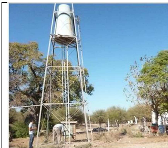
Figura 3. Medición nivel estático. Perforación Aguas Colorada

Para determinar los niveles estáticos de las perforaciones ubicadas en el área de estudio se utilizaron sondas piezométricas con alarmas sonoras y lumínicas, con una apreciación de 1cm. Las mediciones se realizaron en un periodo de dos años (Fig. 3 y Fig. 4).