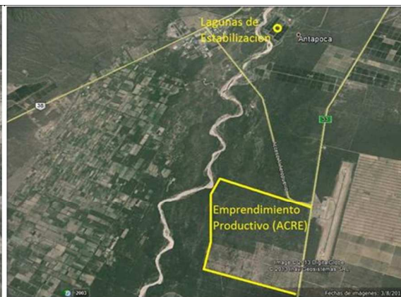
Figura 2: Imagen satelital de la ubicación del área del emprendimiento productivo y de la planta depuradora.

Cada módulo está integrado por una serie de cinco lagunas: una anaeróbica, seguida de una facultativa y tres de maduración (primaria, secundaria y terciaria). La planta está ubicada al sureste de la Ciudad Capital, en la localidad de Antapoca, departamento Valle Viejo, entre los ríos Del Valle y Santa Cruz. Trata en la actualidad un caudal de 58.232 m 3 /día de efluente (Aguas Catamarca. SAPEM, 2013), que es volcado en el cauce del río Santa Cruz sin ningún reuso.