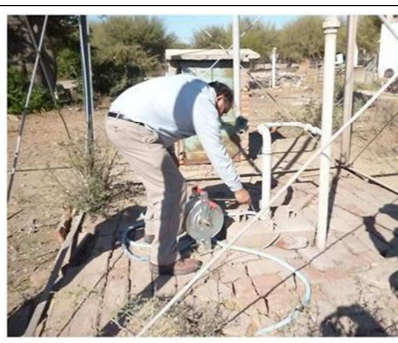
Figura 4. Medición nivel estático. Perforación ACRE