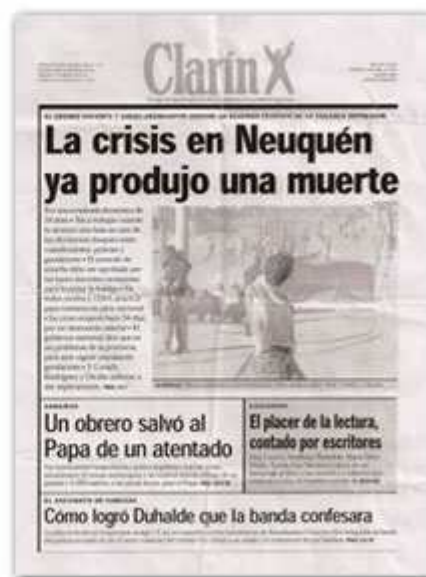
A la izquierda, la tapa de Clarín del día después de los crímenes. A la derecha se puede observar que la