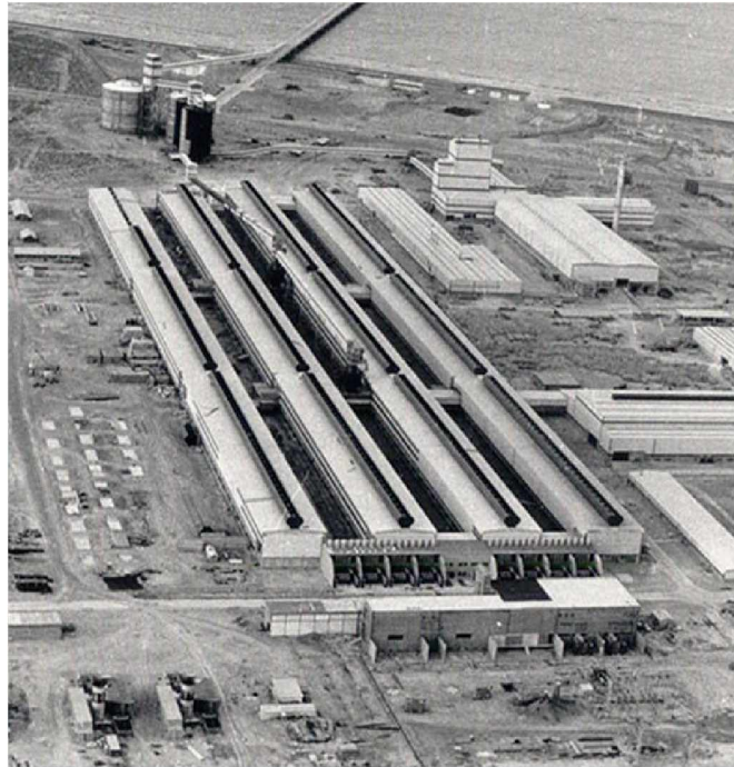
Fig. 1. Planta de Aluar en Puerto Madryn, año 1974.

La capacidad técnica adquirida para la fabricación de calculadoras en la División Electrónica había sido esgrimida por FATE como una demostración de que la empresa podía encarar proyectos tecnológicos complejos [6]. 3 Esas capacidades acumuladas en la División Electrónica, en medio de la crisis que atravesaba la producción de calculadoras tras los cambios arancelarios en la importación de componentes posteriores al golpe de estado de 1976 –que hicieron que fuese más costoso importar las partes de una calculadora que una terminada– serían nuevamente utilizadas como un insumo estratégico por parte de ALUAR.