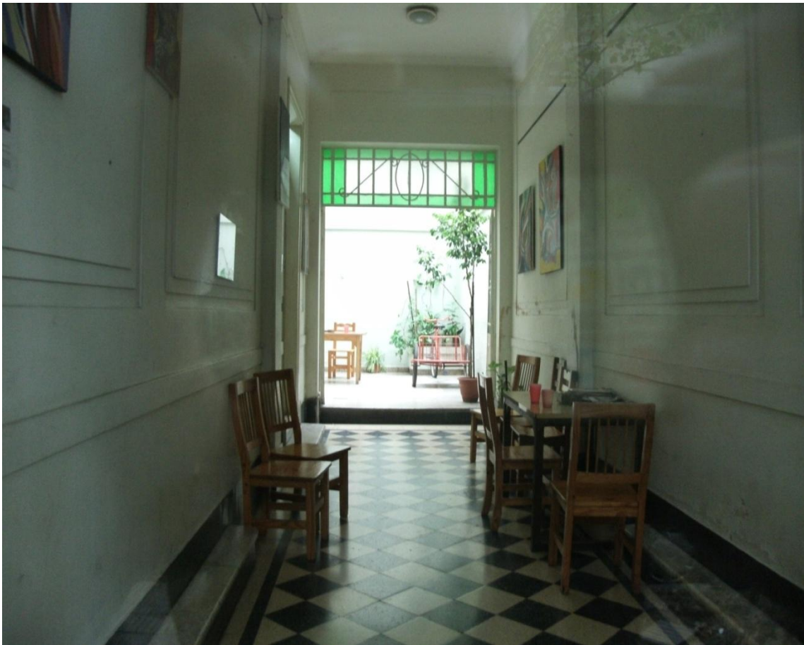
Hall de entrada de Casa Pre Alta, ubicada en 56 entre 9 y 10, ciudad de La Plata.

Preguntarse por el sujeto, por aquello que el contexto va dejando en negativo, escuchar certezas insólitas que “son” para otro sujeto irrefutables, implica estar abiertos a comprender un mundo que se rige bajo una estructura psíquica determinada, a la que invitamos al lector a conocer, a través de la historia del espacio comunitario concurrido por los usuarios: Casa Pre Alta .