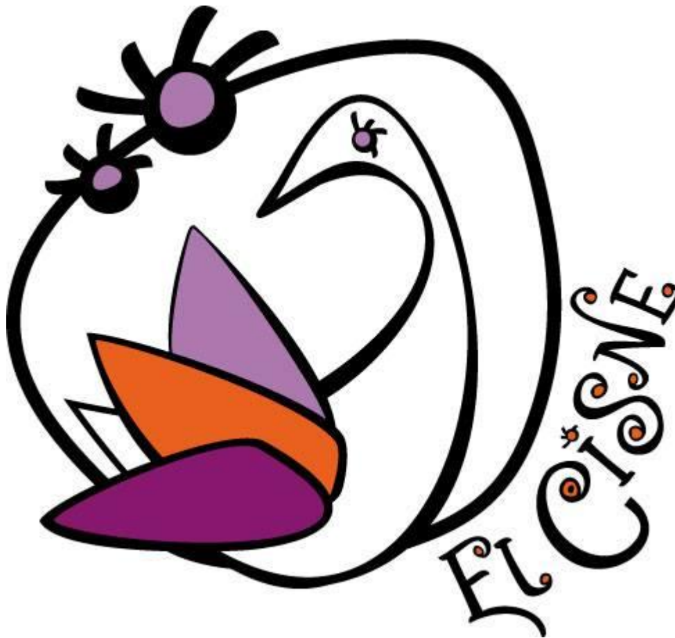
Logo oficial del Taller artístico comunicacional “El Cisne del arte”, de Casa Pre Alta