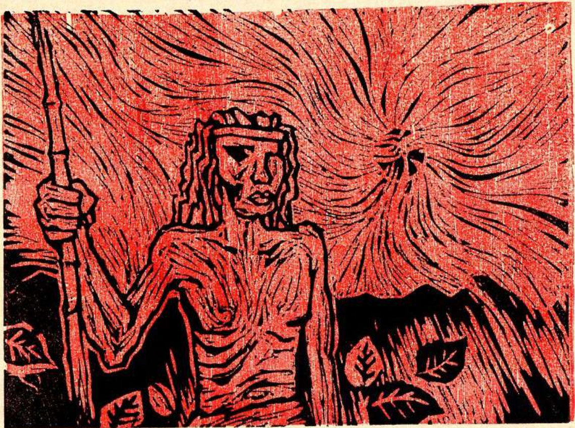
"MADRUGADA EN EL TREN DEL IMPERIO" LINOGRAFIA 11/40 Artista