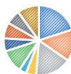
Gráfico 1.

Para la elección de las palabras se efectuó el análisis manual basado en la experticia temática, organizando y agrupando las palabras en cada categoría – meta, esto permitió obtener los grupos de palabras de las cuales se eligieron 150 palabras cuya frecuencia era igual o mayor a tres en cada discurso individual, las cuales se utilizaron para crear una nube (Figura 1) con las palabras más representativas dentro del corpus.