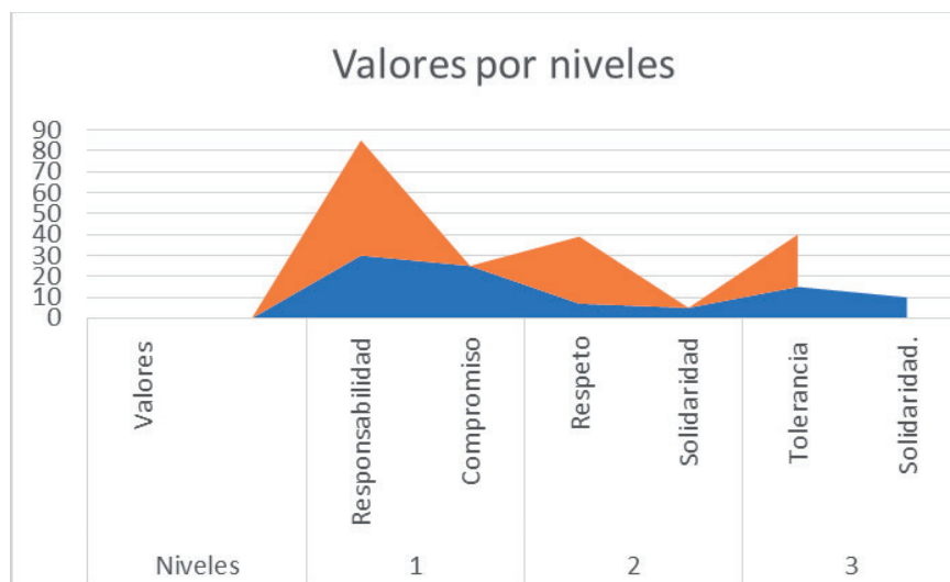
Gráfico 2.

Teniendo en cuenta los resultados, se procedió a realizar la construcción colectiva de una nube de palabras, cuyo objetivo se orientó fundamentalmente a recopilar la opinión de los estudiantes con respecto a los valores esenciales para alcanzar el éxito en el proceso de aprendizaje en escenarios virtuales, siendo éstos, escenarios de representación social, que proporcionan un sistema de códigos, principios y valores que sirven para instaurar las normas y los límites que se encuentran dentro de la conciencia colectiva de los participantes. De allí su carácter social y su función práctica.