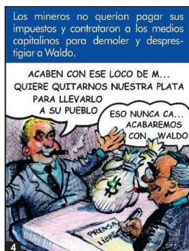
Figura 4. Waldo, la historia que debes conocer y compartir (Waldo a la Región, 2014)

No obstante, se señala que el gobierno central no atendió la solicitud de Ríos, por lo que el candidato tuvo que realizar protestas fuera de palacio de gobierno, sosteniendo un cartel que denunciaba la situación de su región. Según la historieta, Waldo presentaba dos enemigos en ese momento: el expresidente Alberto Fujimori y los dueños de las mineras que trabajaban en Áncash. Así, se afirma que estos dos actores planearon acciones en contra del candidato para que no lograra su objetivo, lo cual se asemeja a los enemigos de gran poder que todo héroe debe enfrentar para lograr con éxito su misión.