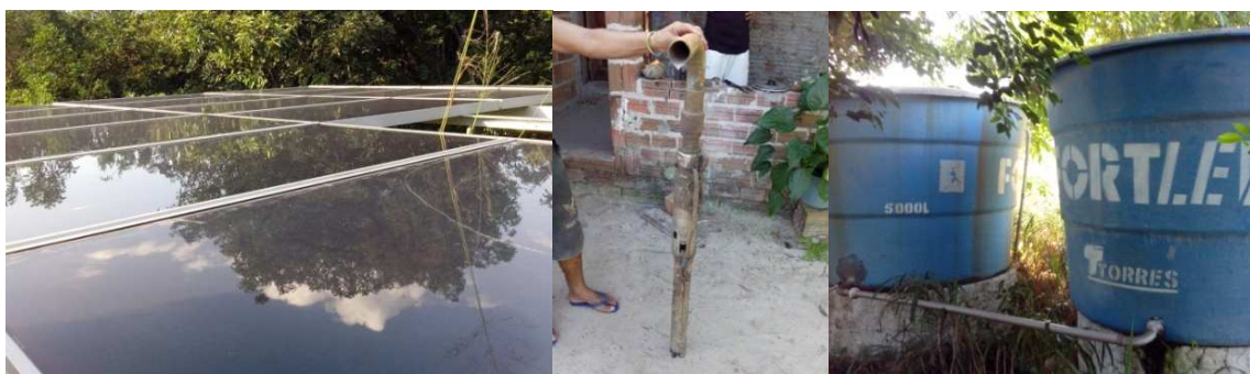
Figura 3–SFB desativado em Bom Jesus, com destaque para os módulos, motobomba e reservatórios

provavelmente por um curto circuito. Após a saída das entidades executoras do projeto a comunidade não conseguiu manter o sistema em funcionamento.