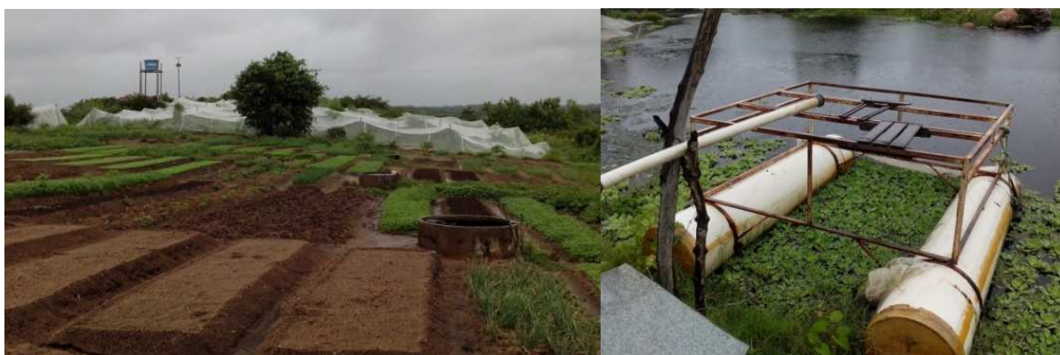
Figura 6 –Área de plantio e local de captação da água no rio.

também nessa horta anexo, não irrigada e sem telado. Uma reclamação recorrente é sobre a limitação da vazão do SFB, bem como da falta de apoio técnico agrícola.