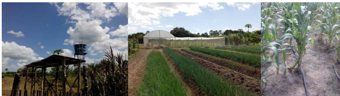
Figura 4- Detalhes do SFB instalado em Granja, com destaque para os módulos, reservatório de água, estrutura telada para cultivo protegido e sistema de irrigação localizado.

Finalmente em 2010, foi instalado outro sistema pelo Instituto Agropolos, a Secretaria do Desenvolvimento Agrário do Estado do Ceará - SDA e a Prefeitura Municipal na comunidade de Jatobá, município Deputado Irapuan Pinheiro. O sistema é composto por 3 módulos de 40 Wp, totalizando uma potência de 120 Wp, uma motobomba flutuante de diafragma importada, reservatório elevado uns 5 metros e um sistema de irrigação com microaspersores.