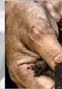
Manos suaves pero escamosa

° simetria de almas, → Acromía-Color ° binomios, → Cuáles? Dominante y un acento de color. O viceversa??