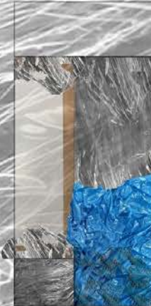
Boceto en collage

Sueño puerta del inconciente. Sueños recurrentes