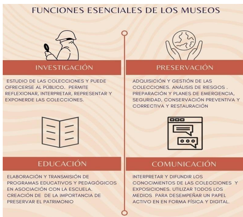
Figura 2. Funciones de los Museos reseñadas por UNESCO .

Para completar la clasificación de las funciones museísticas se aplicó la técnica del análisis de contenido cualitativo (tanto visual como textual) de las acciones difundidas en páginas web de los museos a fin de catalogar cuantitativamente las estrategias que las instituciones culturales elaboraron en relación a la propagación, difusión de material y recursos culturales educomunicativos.