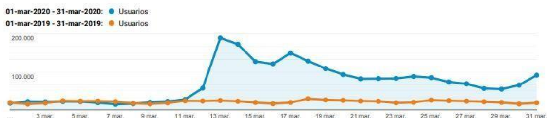
Figura 1: Aumento de usuarios en la web del Museo del Prado 2020.

La iniciativa #PradoContigo, un programa de actividades a través de sus redes sociales y página web para mantener su conexión con el público, ha logrado atraer a 1.969.852 usuarios desde el pasado 12 de marzo, día en el que el Museo del Prado cerró sus puertas ante la situación de crisis sanitaria global causada por la Covid-19 (Museo del Prado, 2020).