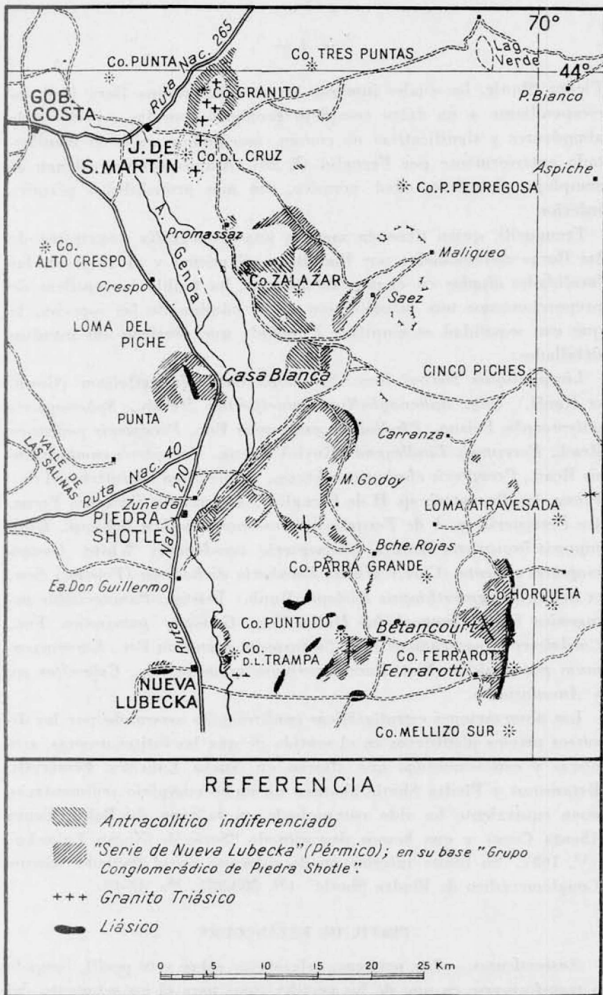
Fig. 1.— Distribución de los afloramientos suprapaleozoicos entre Nueva Lubecka y José de San Martín (provincia de Chubut).