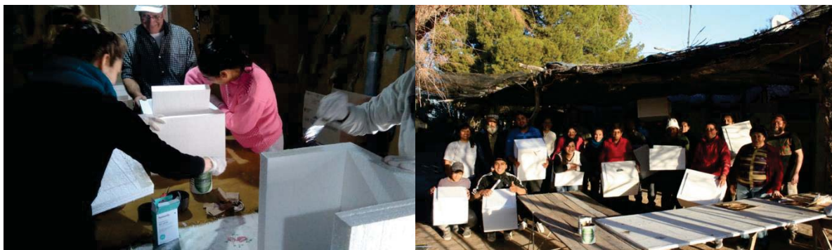
Figura 2: Foto del taller de armado de cajas térmicas.

solar. El equipo planificó comenzar el trabajo con la Comunidad con el taller de autoconstrucción de la caja térmica –realizado durante agosto de 2019-, dado que la misma es un dispositivo de fácil construcción que serviría como un puntapié inicial para capacitaciones y talleres más complejos. Pasados los meses, los y las integrantes de la Comunidad han realizado numerosas cocciones con la caja térmica construida (carne, pastas, hortalizas, mermeladas) demostrando una incorporación satisfactoria de dicha tecnología. Asimismo, al realizar los talleres de manera participativa, quienes asistieron al taller organizaron luego un encuentro para compartir conocimientos con quienes no pudieron concurrir a la fecha y horario acordado. De esta manera, se generó un intercambio de conocimientos sobre el funcionamiento y construcción de las cajas solares. El taller se realizó en uno de los puestos que cuenta con espacio suficiente y se encuentra localizado a una distancia accesible para todos los miembros de la Comunidad (Figura 2).