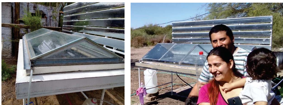
Figura 4: destilador solar de batea y la familia que recibe el destilador.

Por otro lado, tomando en cuenta la tecnología disponible en el INAHE, fruto de investigaciones previas (Esteves et al., 2009; Esteves et al., 2015) se construyeron dos destiladores solares que permiten con un funcionamiento muy sencillo, tomar en cuenta la potabilización del agua disponible en los puestos. Al destilar el agua, los contenidos salinos se reducen casi totalmente, pasando de un agua de unos 4000 \mu\text{S}/\text{cm} de conductividad eléctrica a agua destilada con <17 \mu\text{S}/\text{cm} (Esteves et al., 2013).