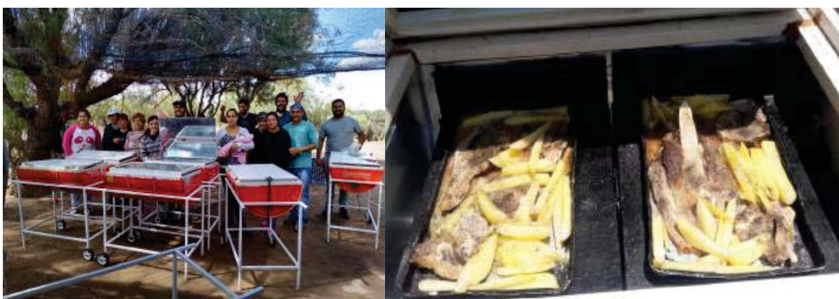
Figura 3: Foto del taller de armado de hornos solares y demostración de cocciones posibles.

El segundo paso fue diseñar y construir las huertas familiares. Para esto, se comenzó con la preparación de tierra fértil, preparación de plantines y además con armado de cierre de tela romboidal por los laterales y colocación de tela antigranizo para evitar no sólo la acción del granizo, sino también la incursión de aves (especialmente catas) que atacan la producción. Cabe aclarar que cada infraestructura se realizó teniendo en cuenta las condiciones particulares de cada puesto y la cantidad de recursos disponibles. Así, por ejemplo, se diseñaron huertas de mayor tamaño para familias que cuentan con posibilidades de invertir más tiempo en el cuidado de canteros sembrados.