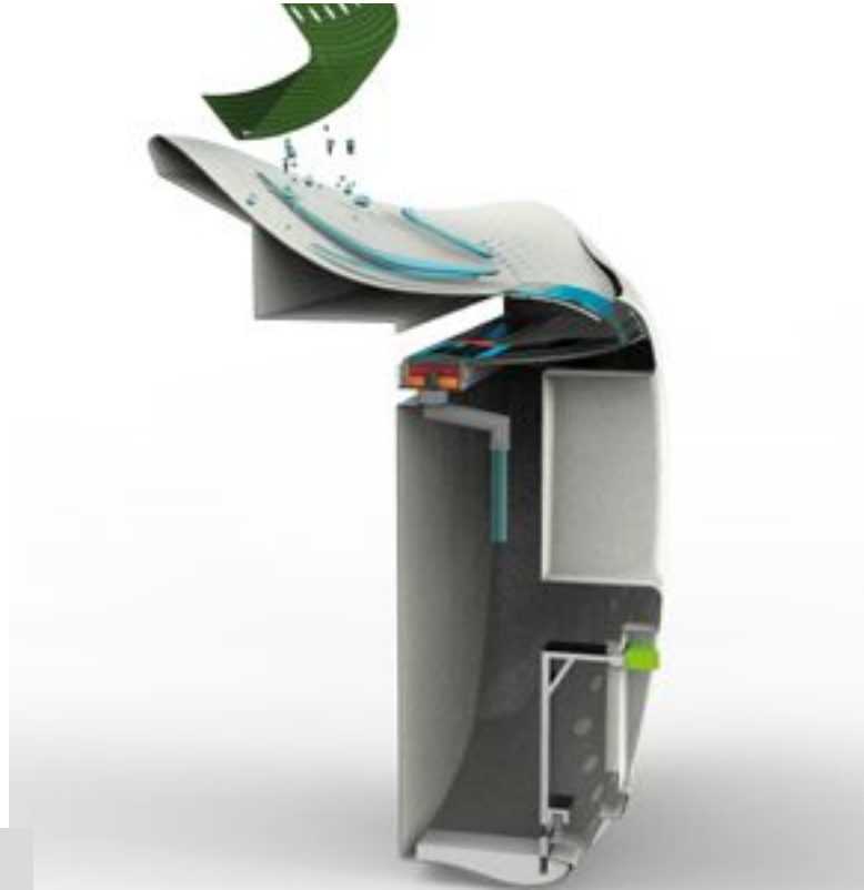
Figura 3. Zonas funcionales

B- Zona de Almacenamiento (70 litros): previo a su almacenamiento, el agua pasa por dos zonas de filtrado. La primera en la cara superior de la cisterna que posee orificios que separan partículas visibles y la segunda ocurre dentro del tanque, mediante pastillas de carbón activo que, junto con el cloro sólido, terminan de acondicionar el agua [Figura 3].