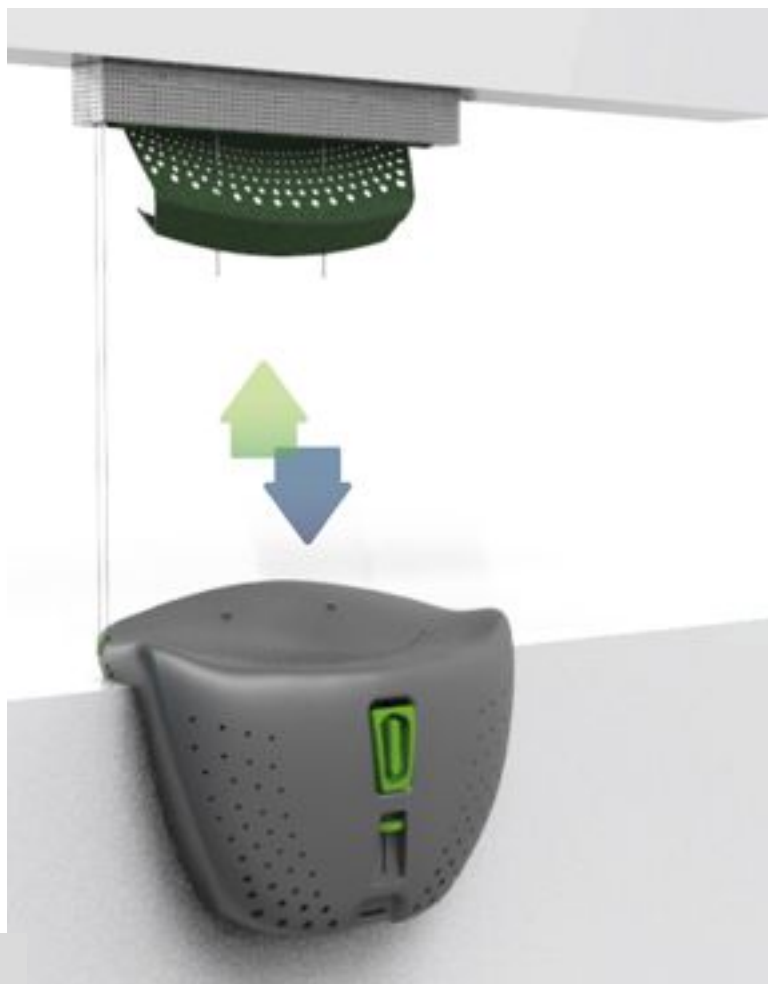
Figura 4. Procesos de filtrado

El segundo filtrado ocurre en la cara superior de la cisterna que posee micro perforaciones. El tercer filtrado acontece dentro de la cisterna, donde las pastillas de cloro y carbón se encargan de hacer un último microfiltrado. El cloro se utiliza para matar hongos o bacterias y el carbón de 25 micras le proporciona un filtrado eficaz. El tanque contenedor se encastra a las barandas o muros de los balcones mediante un sistema que hace posible su colocación cualquiera sea el espesor y la forma de las paredes.