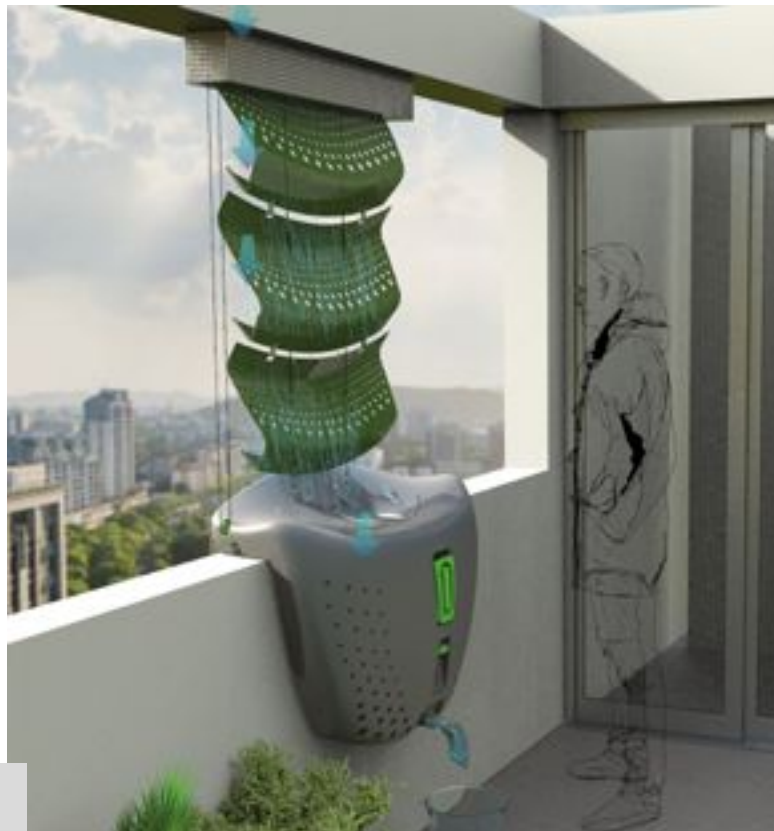
Figura 1. Sistema de recolección de humedad ambiental

Mawun es un sistema de recolección de humedad ambiental que parte de la idea de revalorizar elementos que nos brinda la naturaleza y de esta manera cuidar el medio ambiente [Figura 1].