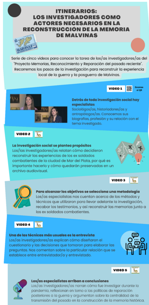
Figura 3. Poster de difusión del material didáctico del proyecto