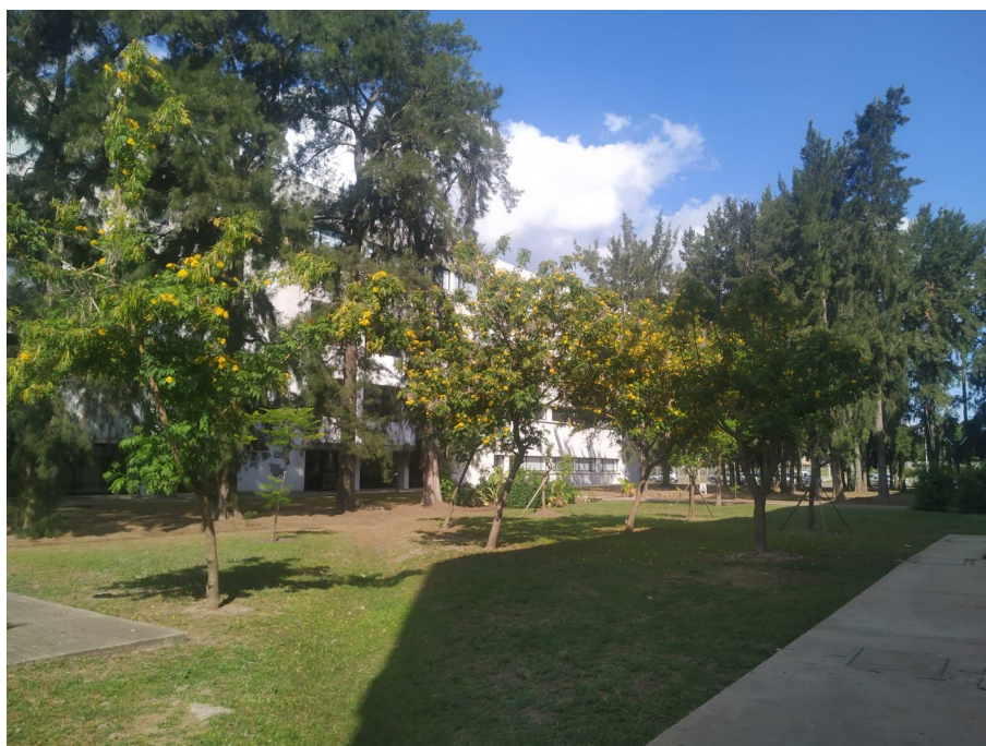
5) Jardín de la memoria