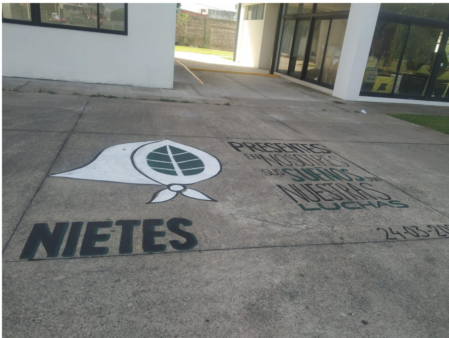
Cartel de señalización del sitio de memoria