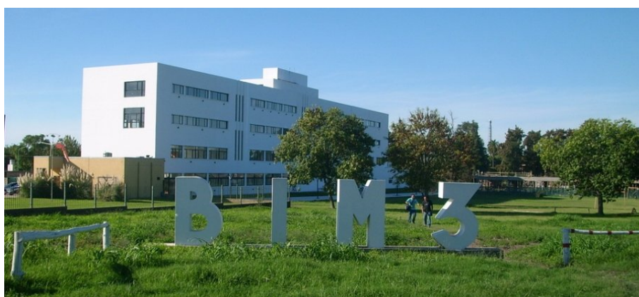
3) Entrada al predio